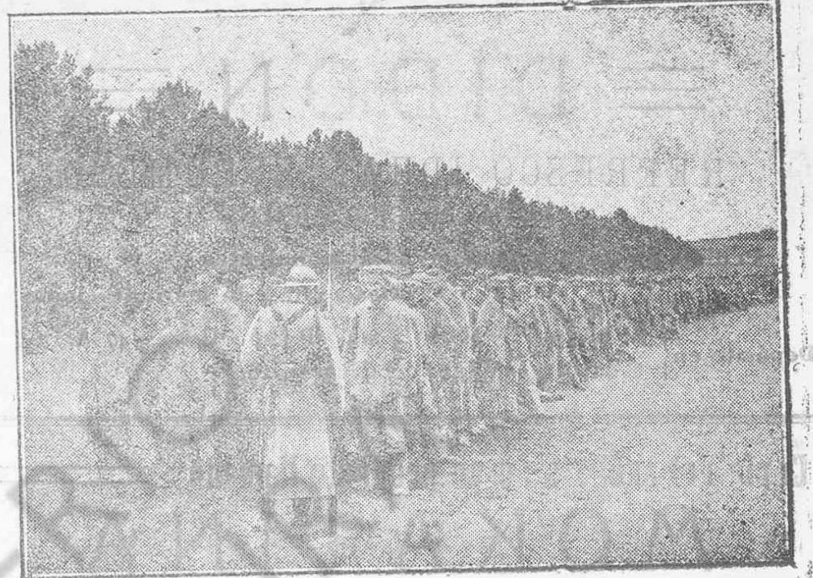
Una columna de prisioneros alemanes conducidos hacia la retaguardia de las líneas francesas.

El aprovisionamiento de trigos extranjeros que hasta hace tres meses habíamos podido conseguir comprando en Barcelona, unas veces a la especulación, otras, directamente a los representantes de las casas vendedoras y en alguna ocasión el Gobierno, no lo podemos hacer hoy porque las pocas órdenes de venta que han circulado en la Lonja de Barcelona procedentes de los EE. UU. y Buenos Aires, fueron de momento aceptadas por las principales casas amparadas en la concesión de flete reducido concedido por la Junta de Transportes, de acuerdo con el Gobierno, puesto que de tener que comprar a los precios de oferta, no hubieran sido aceptadas.