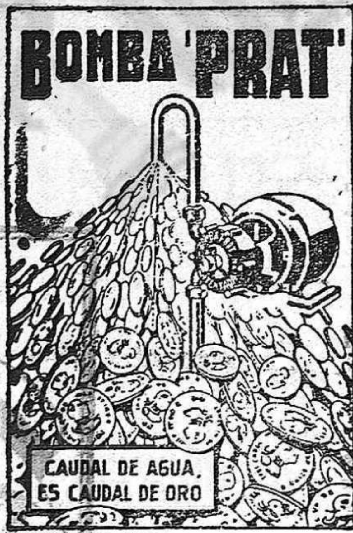
CAUDAL DE AGUA. ES CAUDAL DE ORO

AGUA A COMODIDAD, SIN DESGASTES NI INTERRUPCIONES, Y CON UN CONSUMO DE FLUIDO INSIGNIFICANTE