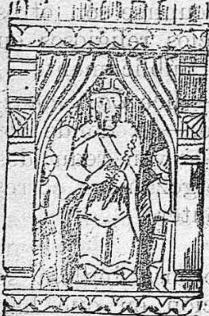
Ajedrez llamado de Carlo Magno, existente en el Gabinete de Medallas de París.

Así en el primero el alfil es un elefante con todos sus pelillos, su cornak indio y el indispensable arreo oriental; la torre una cuadriga como pudo estilarse en los tiempos de Job vino ó Teodosio; el rey y la reina parecen Ludovico y Ermengarda en el trono con sus meninos; los caballeros y peones en nada discrepan de los soldados francos de la dinastía carolingia. Los alfiles ( arphils ) son como jueces ó asesores. Los raunes hacen de gobernadores.