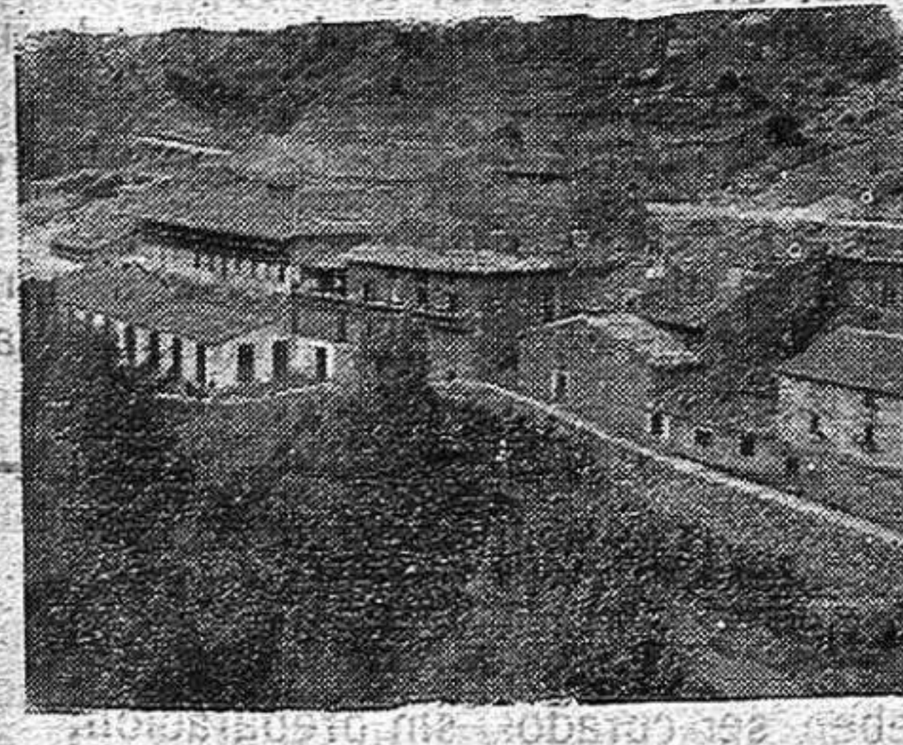
Vista exterior de la fábrica de Artola

masa no se pase de punto y fermente demasiado la levadura. Como además del pan las dueñas de casa enriquecen su despensa con la repostería, entre mostachones, pasteles, rosquillas, magdalenas, enrejadillos, mantecados, pan dormido, tortitas y demás golosinas que saben hacer las hacendosas mujeres de esta tierra, hasta las tantas de la noche estarían sin aquella medida previsor.