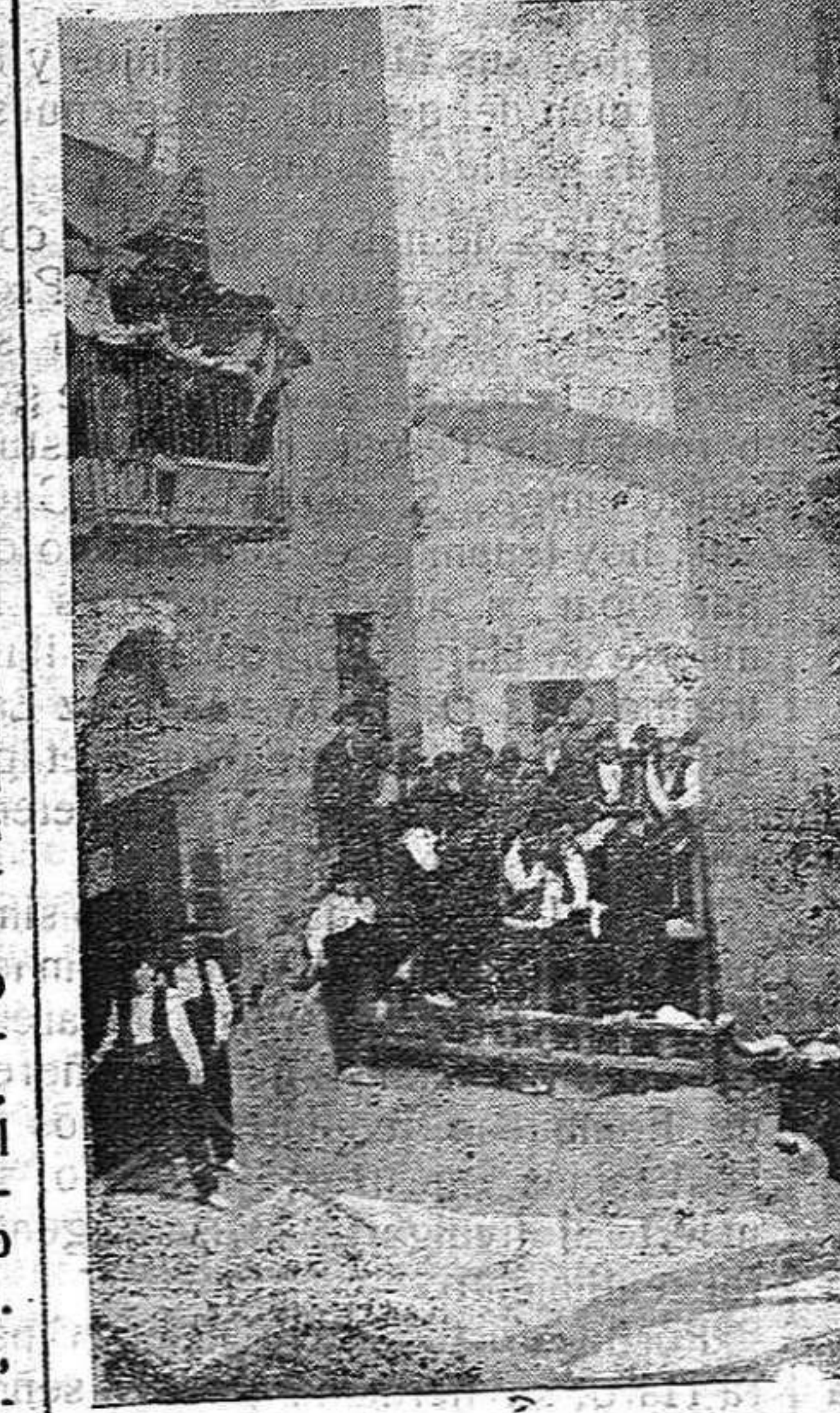
El toro asomando por la esquina de la calle del Mesón