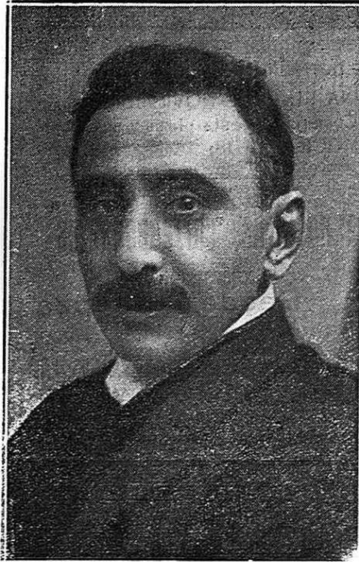
D. Melquiades Álvarez

Jefes de los grupos concentrados que ayer se reunieron en Zaragoza para celebrar un acto de afirmación liberal que constituye el acontecimiento político de actualidad