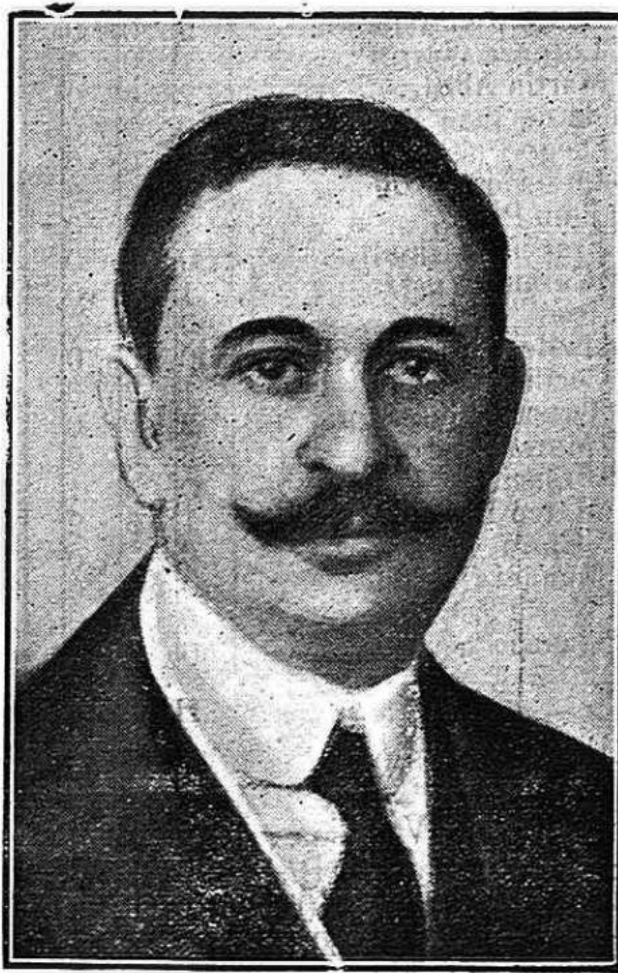
D. Manuel García Prieto