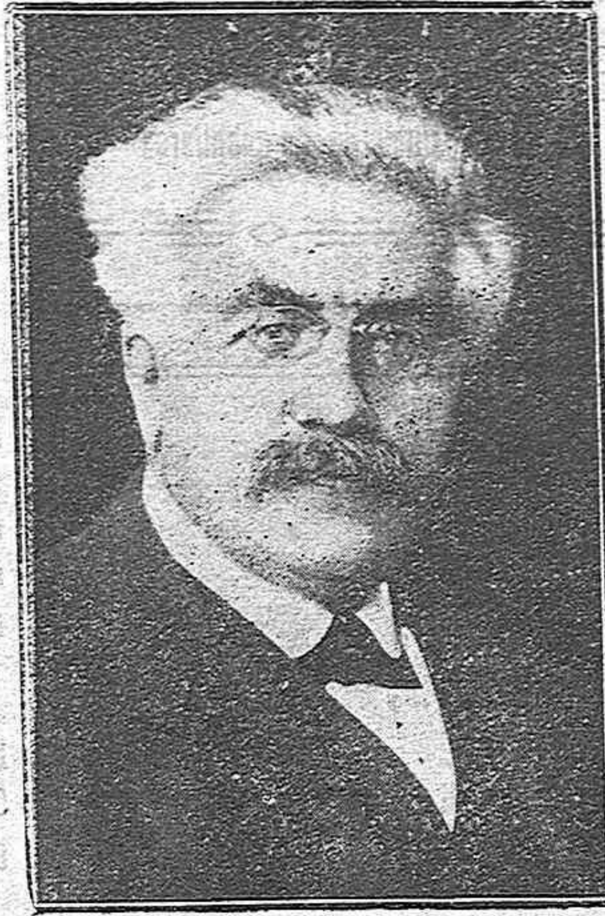
Mr. Alexandre Millerand, expresidente de la República francesa, quien con motivo de la actual lucha política en Francia ha hecho interesantes manifestaciones mientras Mr. Clemenceau, el viejo Tigre, se negaba rotundamente a hacer declaración alguna política.

más tranquilas, poéticamente, las ojas lindan homenaje lo mismo en quietud solemne como agitadas. Como sirven los cañonazos lo mismo para rendir honores que para manifestar discordia.