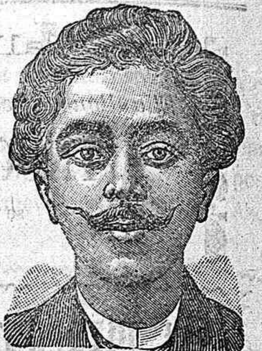
Después de 10 días de curación