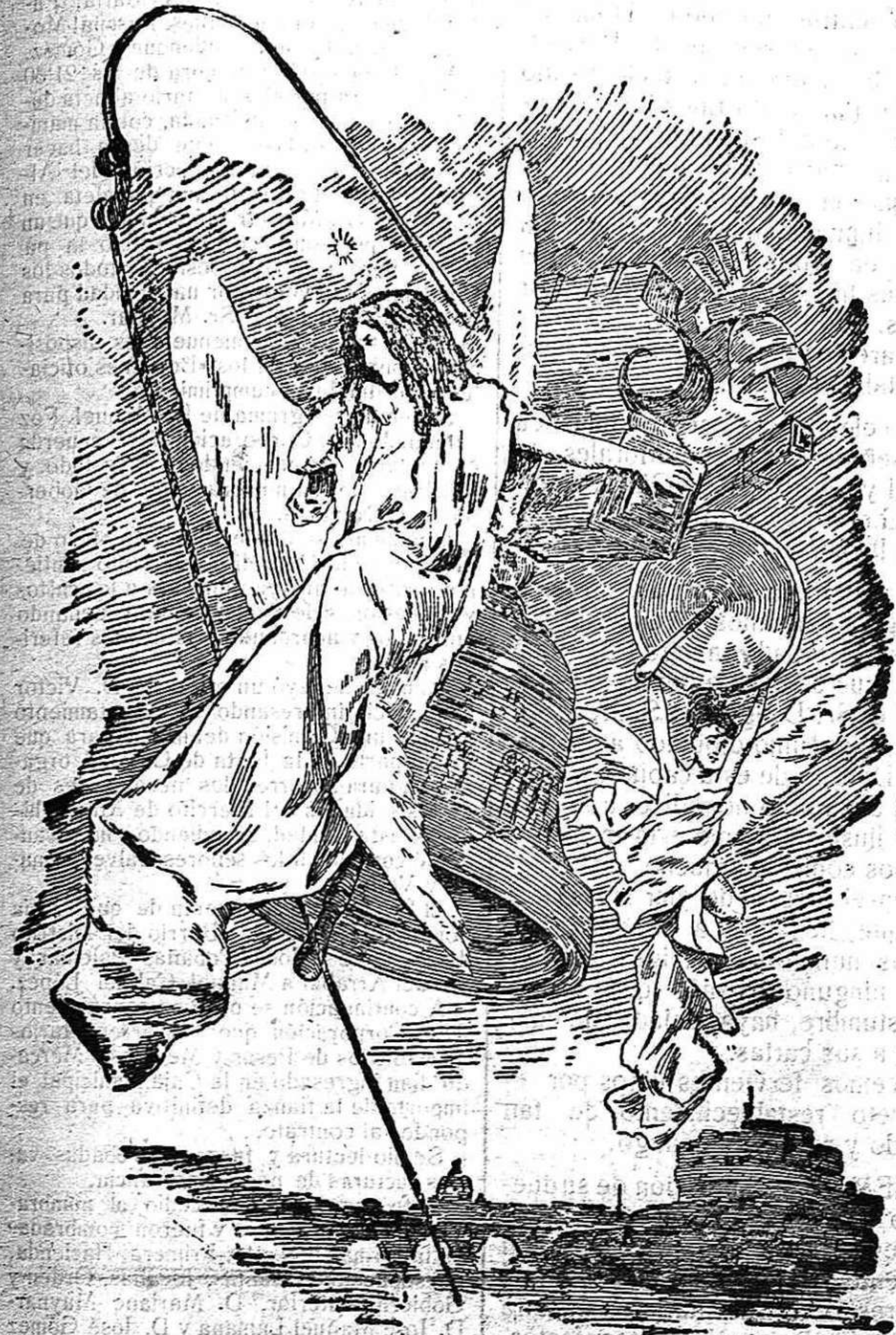
Pintura mural de la Escuela Italiana