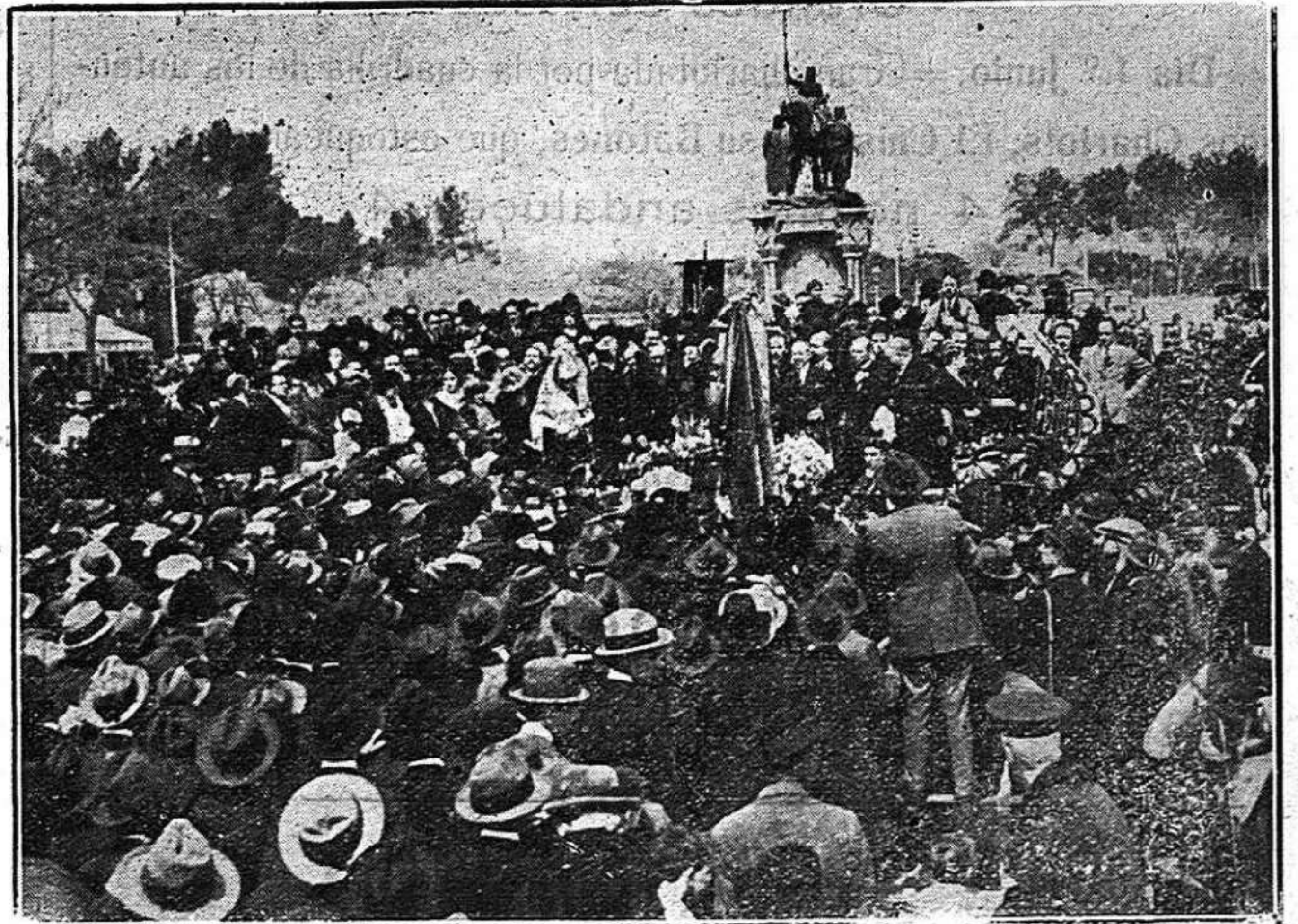
Aspecto del Paseo de la Castellana al llegar la manifestación, celebrada en honor de tan insignes artistas, a la tribuna donde éstos se encontraban, el domingo último.

El corresponsal gráfico de LA PROVINCIA en Madrid nos remite la fotografía adjunta, y aprovechamos su publicación para adherirnos al homenaje nacional que se ha tributado a la ilustre pareja cuya dilatada actuación en la escena ha sido tan gloriosa para España, especialmente en sus frecuentes excursiones a los países americanos de habla castellana, donde se ama a nuestros clásicos y a nuestro teatro a través de las brillantes interpretaciones que la Guerrero y Mendoza saben dar a todos los personajes que representan.