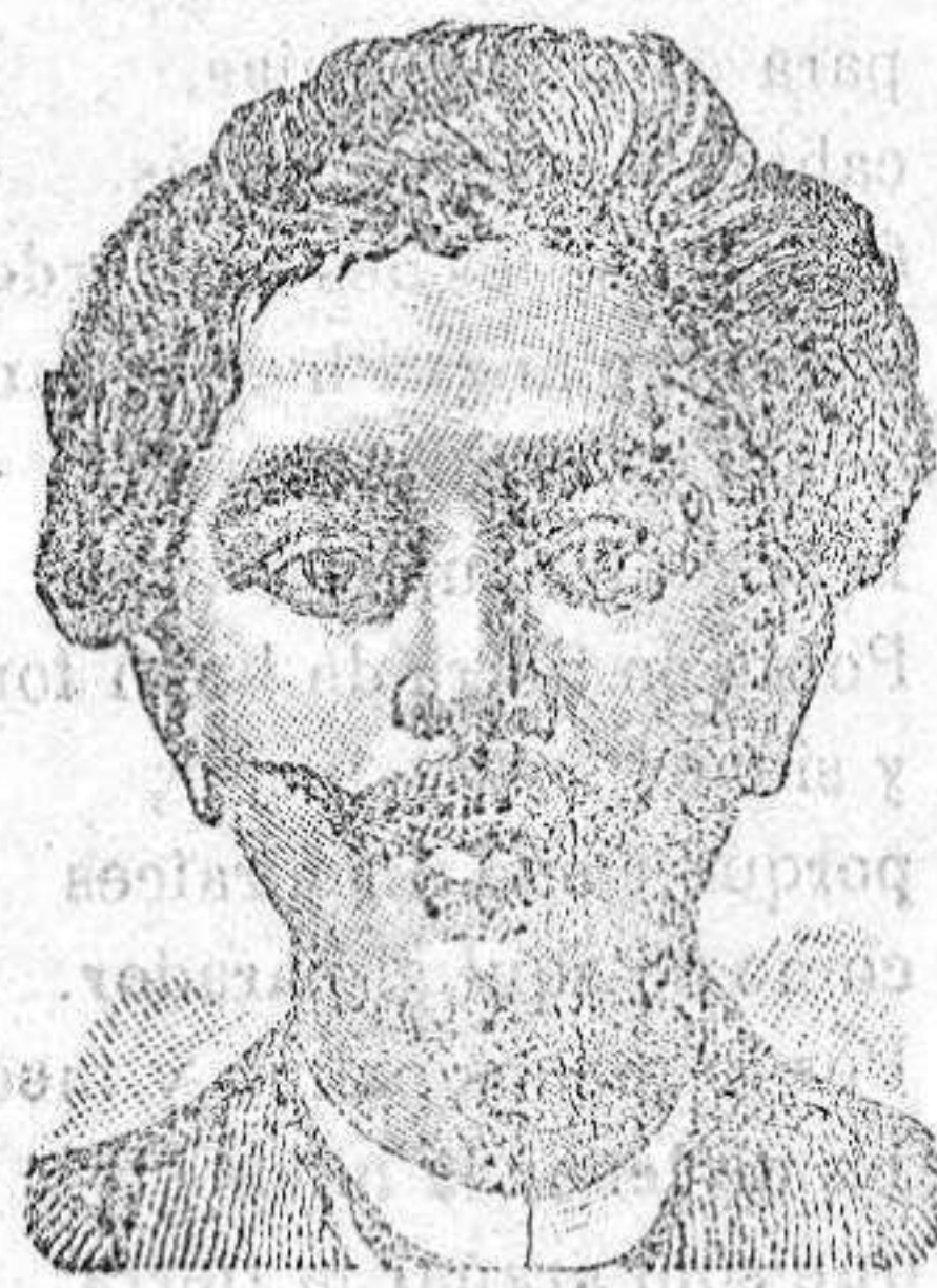
Después de 10 días de curación