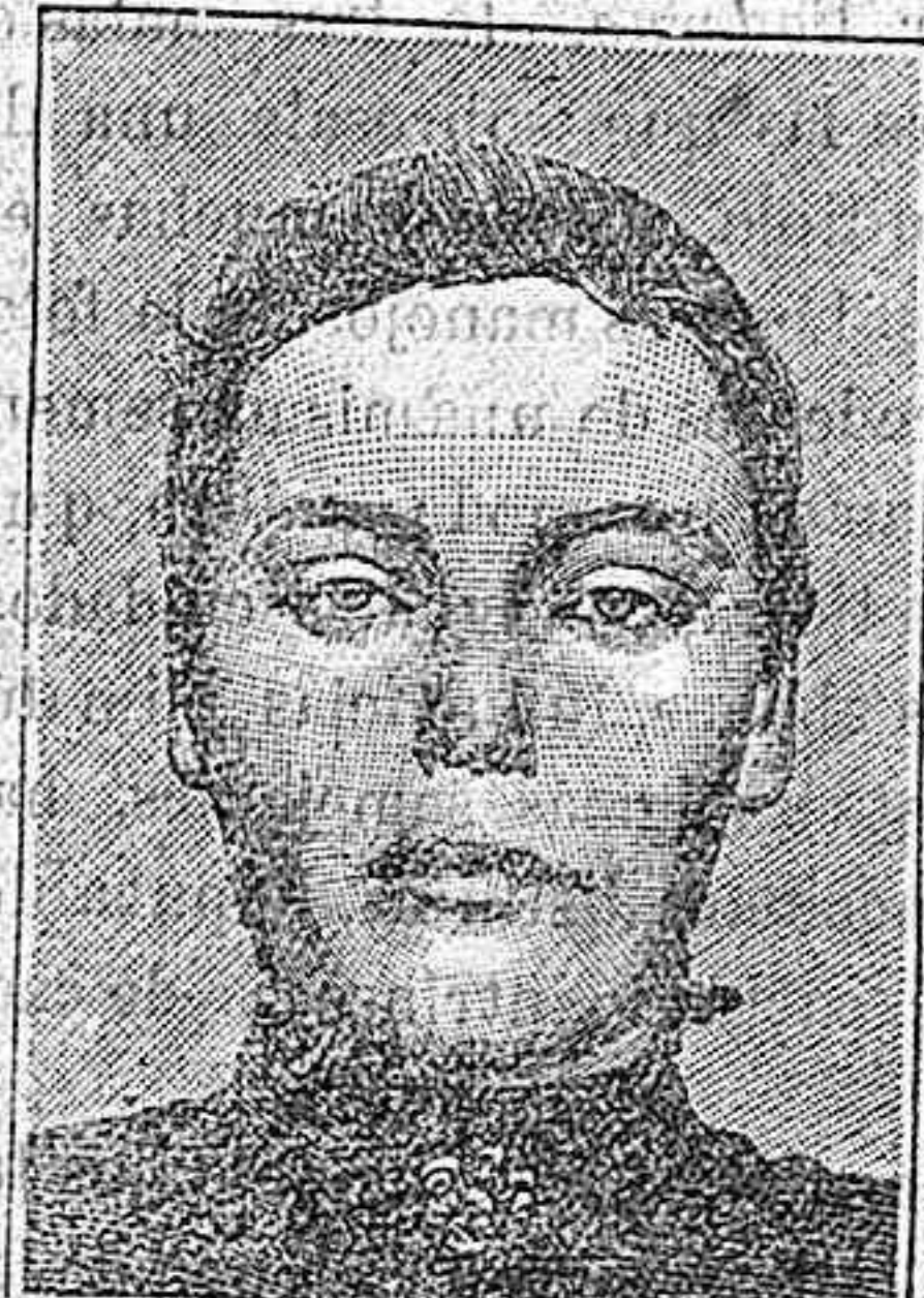
Después de 30 días de curación