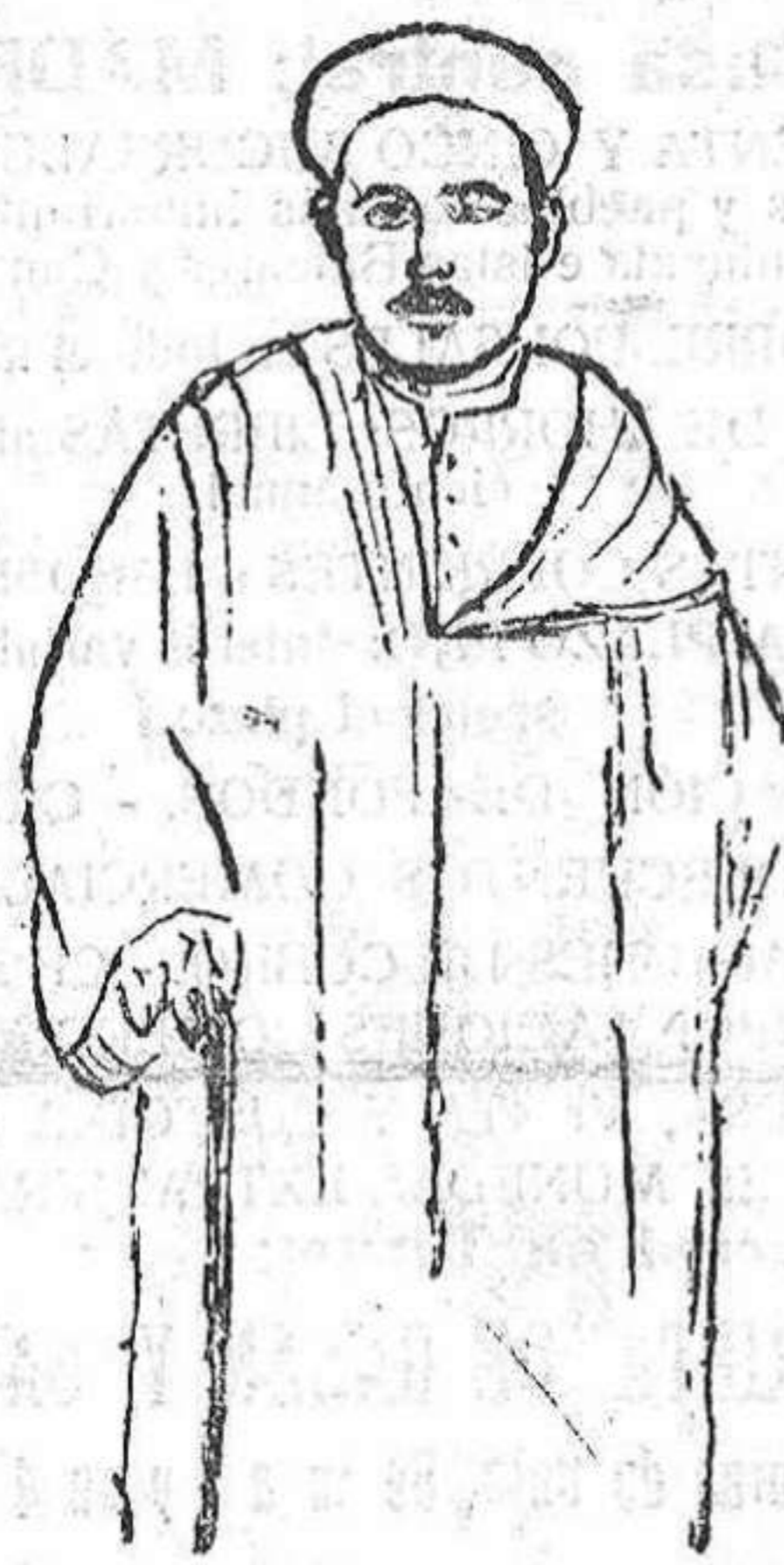
El cabecilla rifeño, acerca de cuya petición de paz deliberan conjuntamente los Gobiernos de Francia y España.

nes; y cuando el mundo, en ruinas todavía humeantes, revueltas con cadáveres apenas sepultados por la tierra ensangrentada; cuando todavía se oye el eco aterrador de los últimos estertores y en nuestros oídos sigue zumbando la fatal palabra ¡guerra! surge como siempre el genio hispano llevando a todos los ámbitos su lábaro civilizador, la palabra de consuelo, y escribiendo para la historia, para la humanidad, la más bella página de paz.