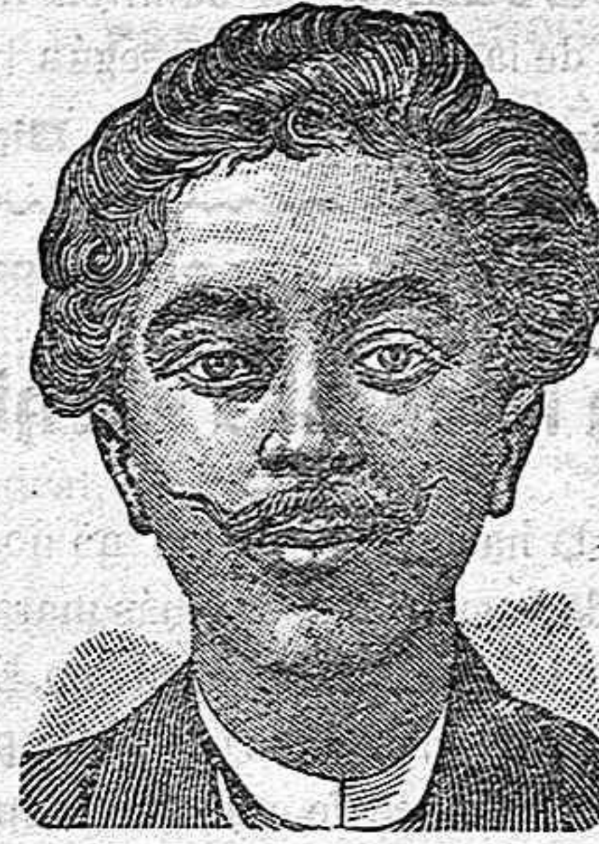
Después de 10 días de curación