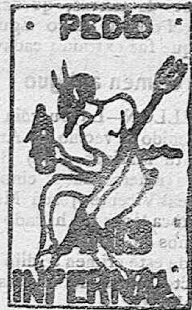
De venta en Cafés y principales Comarcas de Ultramarinos

Se vende uno propio para familia, marca Metalurgique 26 H. P. Limousine, á toda prueba. Informarán, Garage Larramendi, Pipaón y Alberdi.