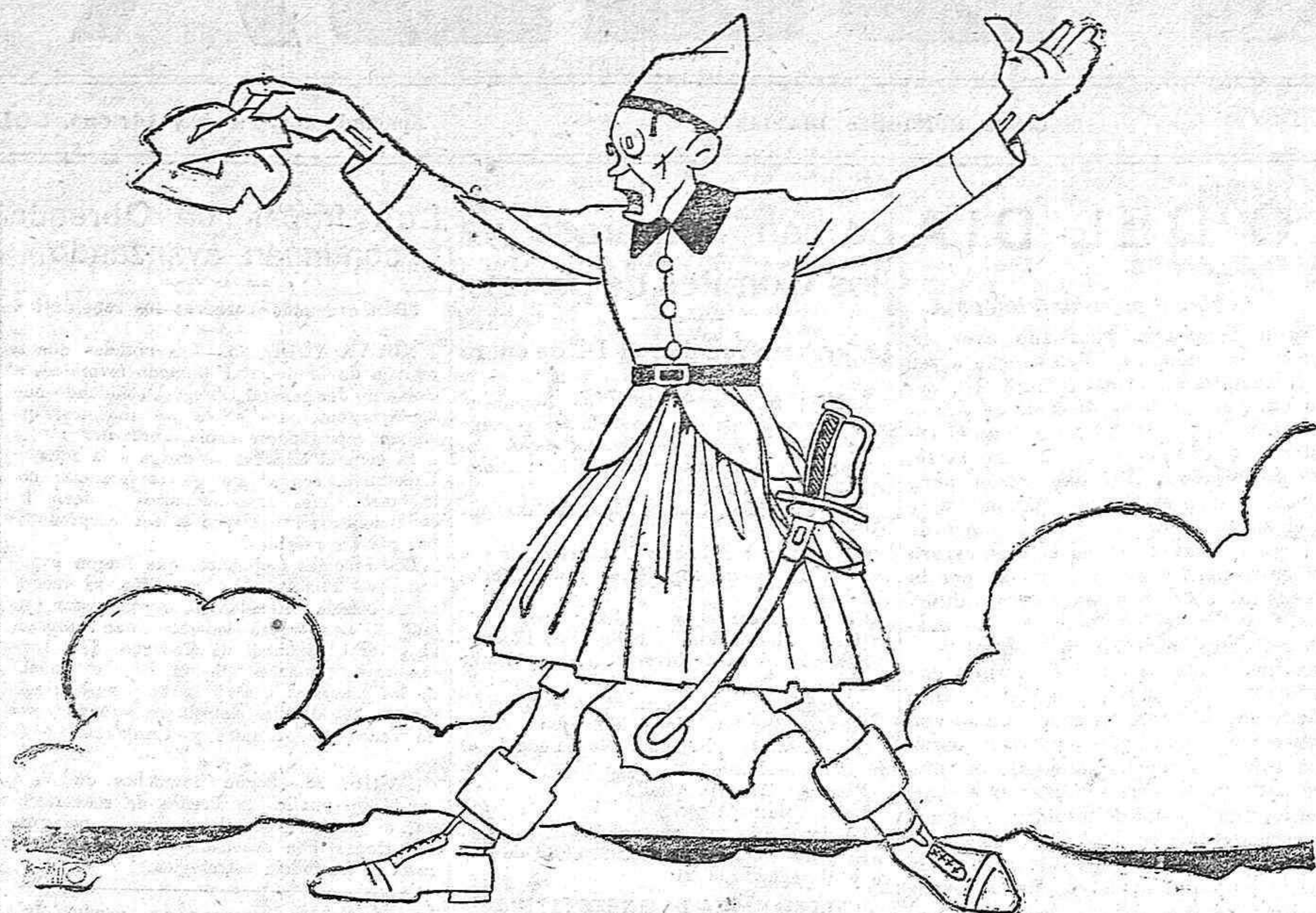
“Ven y ven y Venizelos, veinte conmigo”

da, se convierte en apta para el consumo, Inglaterra puede resistir un peso de impuestos superior al de otros países. Esto quiere decir que la operación quirúrgica a costa del portador de los títulos de la deuda del Estado no ha de ser tan radical como la que ha soportado el poseedor de títulos de la deuda francesa, que ha visto reducida en un 28 por 100 su verdadera renta, ni como la del portador de la deuda belga, a quien se le ha reducido el 25 por 100, ni la del poseedor de la deuda italiana, a quien se le ha disminuido en un 24 por 100. Y no hablamos del rentista de títulos austriacos, alemanes o polacos, que ha sido casi íntegramente expoliado de su crédito contra el Estado.