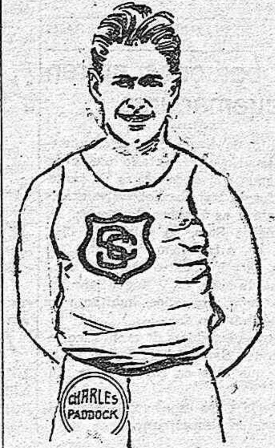
CHARLES W. PADDOCK

¿Quién es el deportista que no conoce siquiera de nombre a este estu-