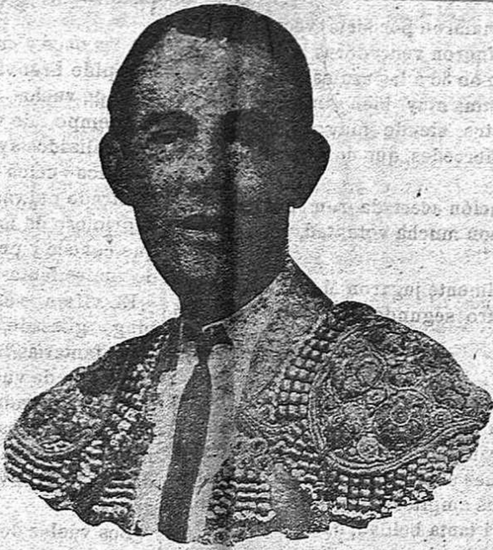
IGNACIO SÁNCHEZ MEJÍAS