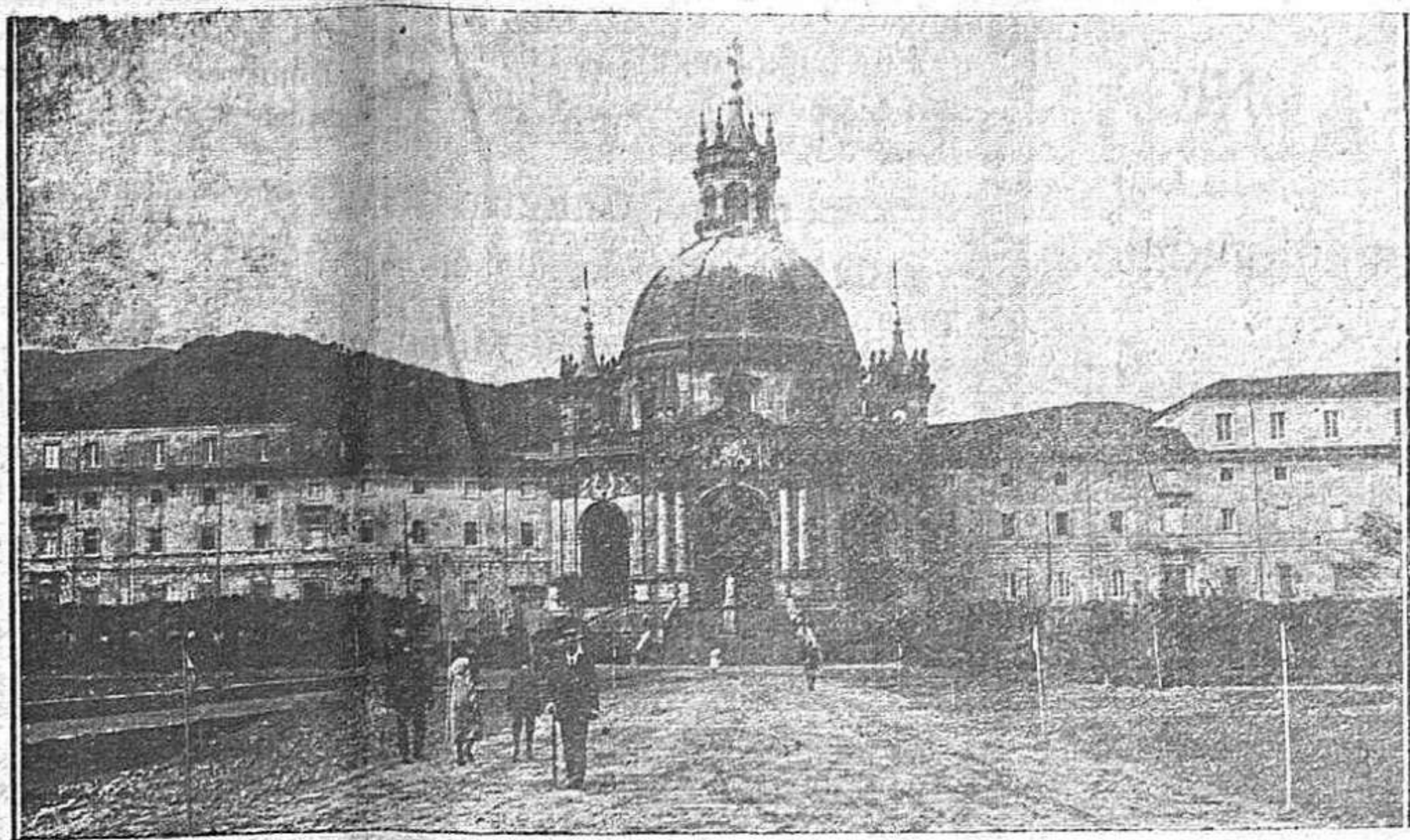
Vista de la Basílica de San Ignacio de Loyola, en Azpeitia

Se vende UNA MAQUINA seminueva de zapatero de brzo. Darán razón: calle de Moraza, número 19, tienda.