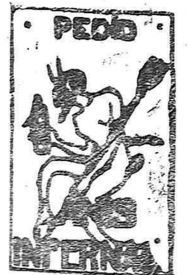
De venta en Cajas y principales Conditores de Ultramarinas