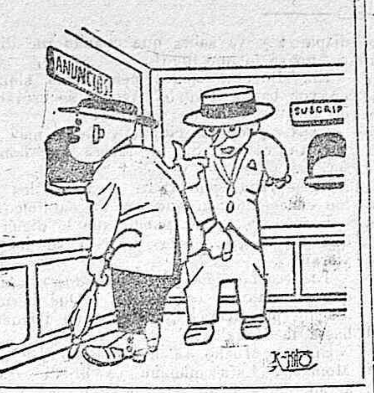
—Sí, señor. Aquí, mi amigo, que quiere poner este anuncio: «Manco del brazo izquierdo se relacionará con manco del derecho, para ir a aplaudir a Alcahofta siempre que torce.»