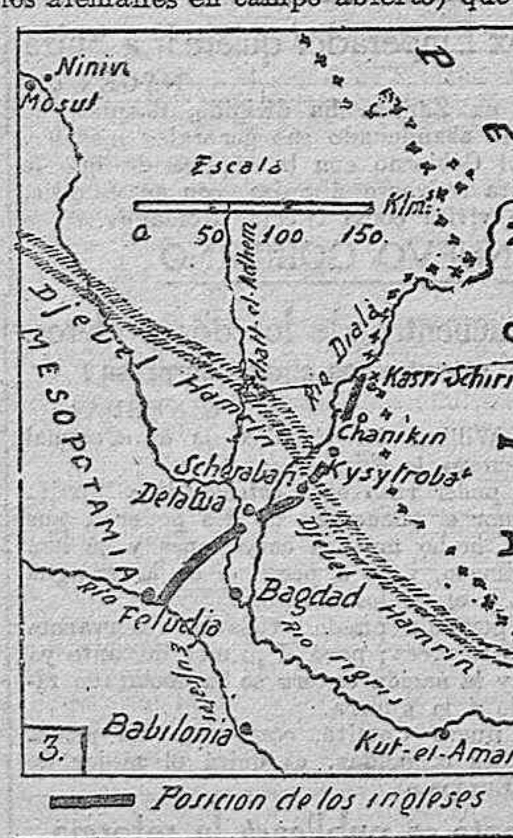
Posición de los ingleses.