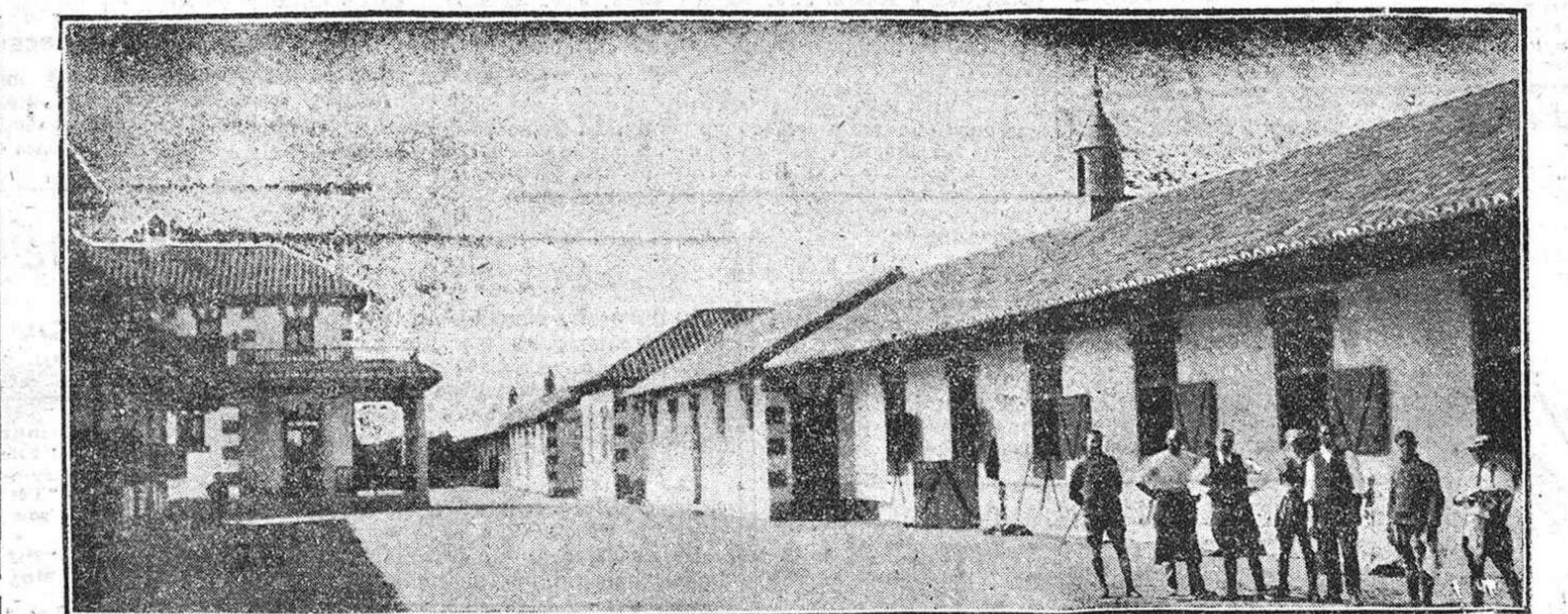
Vista exterior de las cuadras y «chalet» del entrenador.

Faltábale tan sólo poner una cuadra de carreras. Y esto lo consiguió en 1916. Si hemos de admitir que en el actual esplendor del «sturf» español ha contribuido poderosamente la venida de propieta-