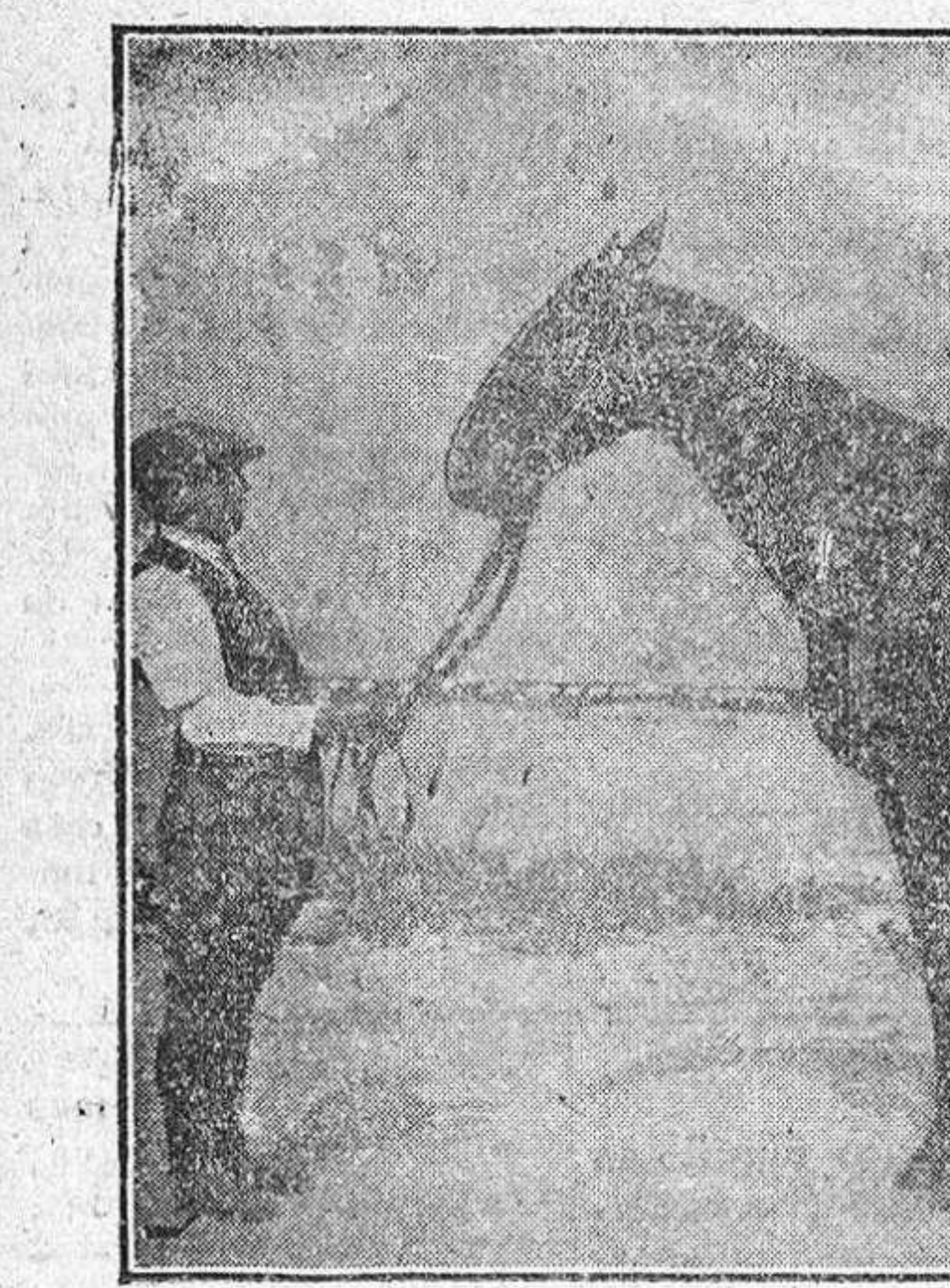
«Olympic» ganadora del Gran Premio de Sevilla

mismas columnas hemos escrito algunos párrafos sobre las carreras como institución, sacando la consecuencia de que constituyen el único medio de aquilatar las cualidades de los caballos y que los perfeccionamientos de la casta caballar son debidos a su feliz influencia. No queremos incurrir en repeticiones. En todo caso, demandamos a los detractores si ellos conocen pruebas más justas y decisivas, y qué garantías de fortaleza se da-