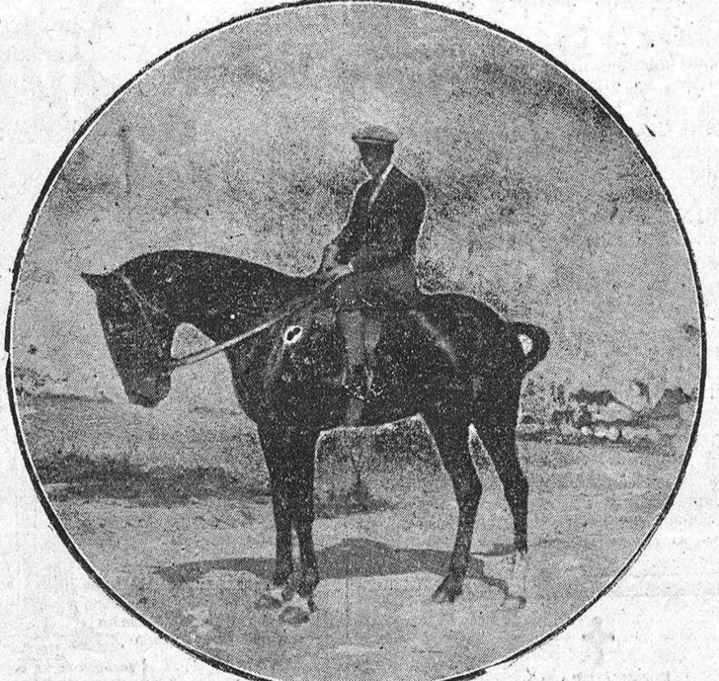
«Beau» uno de los notables ejemplares de la cuadra real. Ganador de importantes carreras.

za la serie no interrumpida de sus triunfos. Disputábase entonces la «Gran Carrera de Vallar», de San Sebastián, dotada de 10.000 francos, y «Boricelli» y «Roi de la Lande» se encargaron de llevar a la victoria los flamantes colores reales, ocupando el primero y tercer puestos respectivamente. Por vez primera, el duque de Toledo condujo del diestro al caballo vencedor hasta el pesaje. Después, de los 31 días restantes de carreras, contadísimos son los días en que no consiguió un primer premio. Sin detallar, diremos que al final de la temporada ocupaba el segundo lugar entre los propietarios ganadores: había ganado 31 carreras, con un total de 154.400 pesetas en premios.