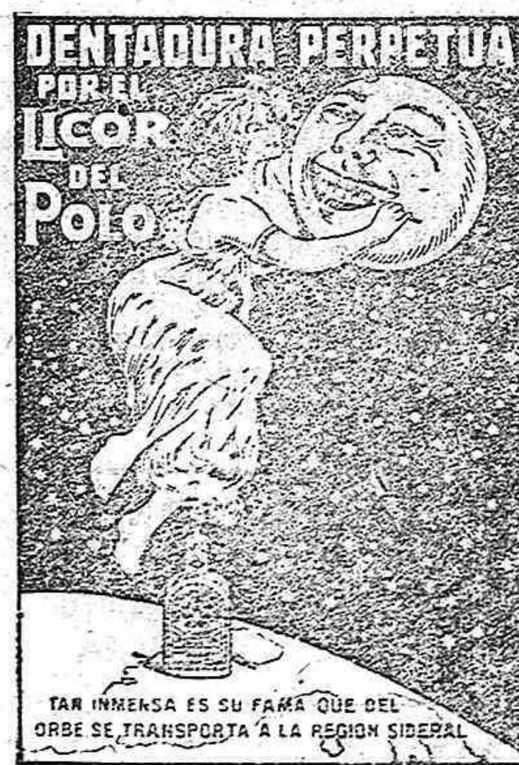
DENTADURA PERPETUA POR LICOR DE POLO