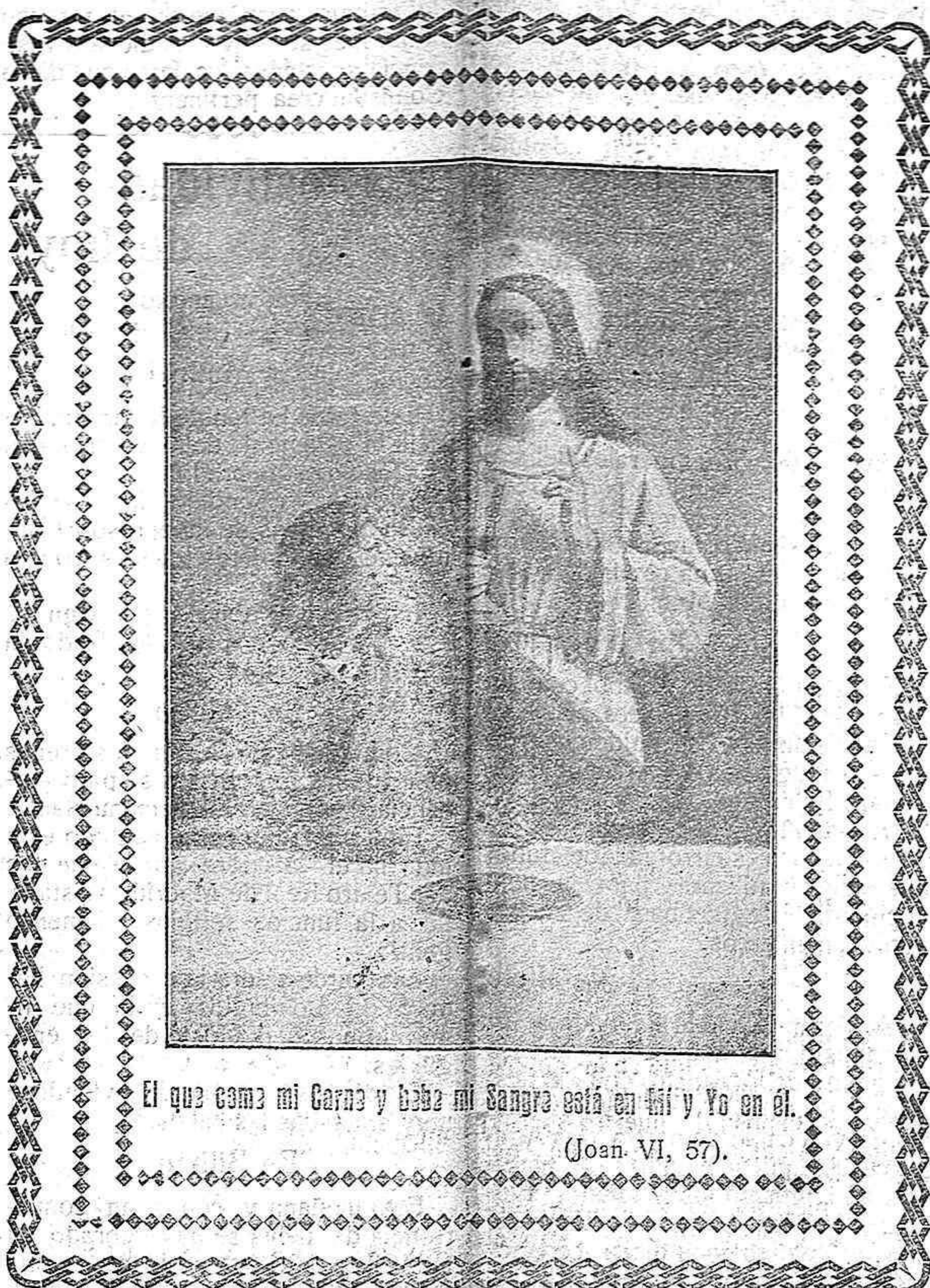
El que como mi Carne y bebe mi Sangre está en mí y Yo en él.