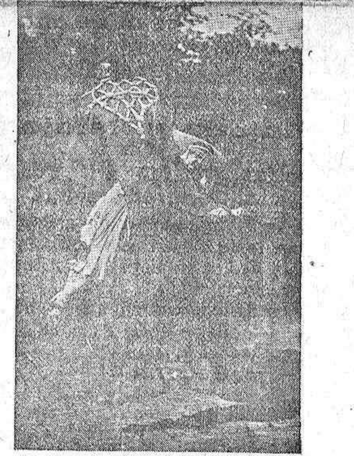
Uno de los números del Circo Palisse