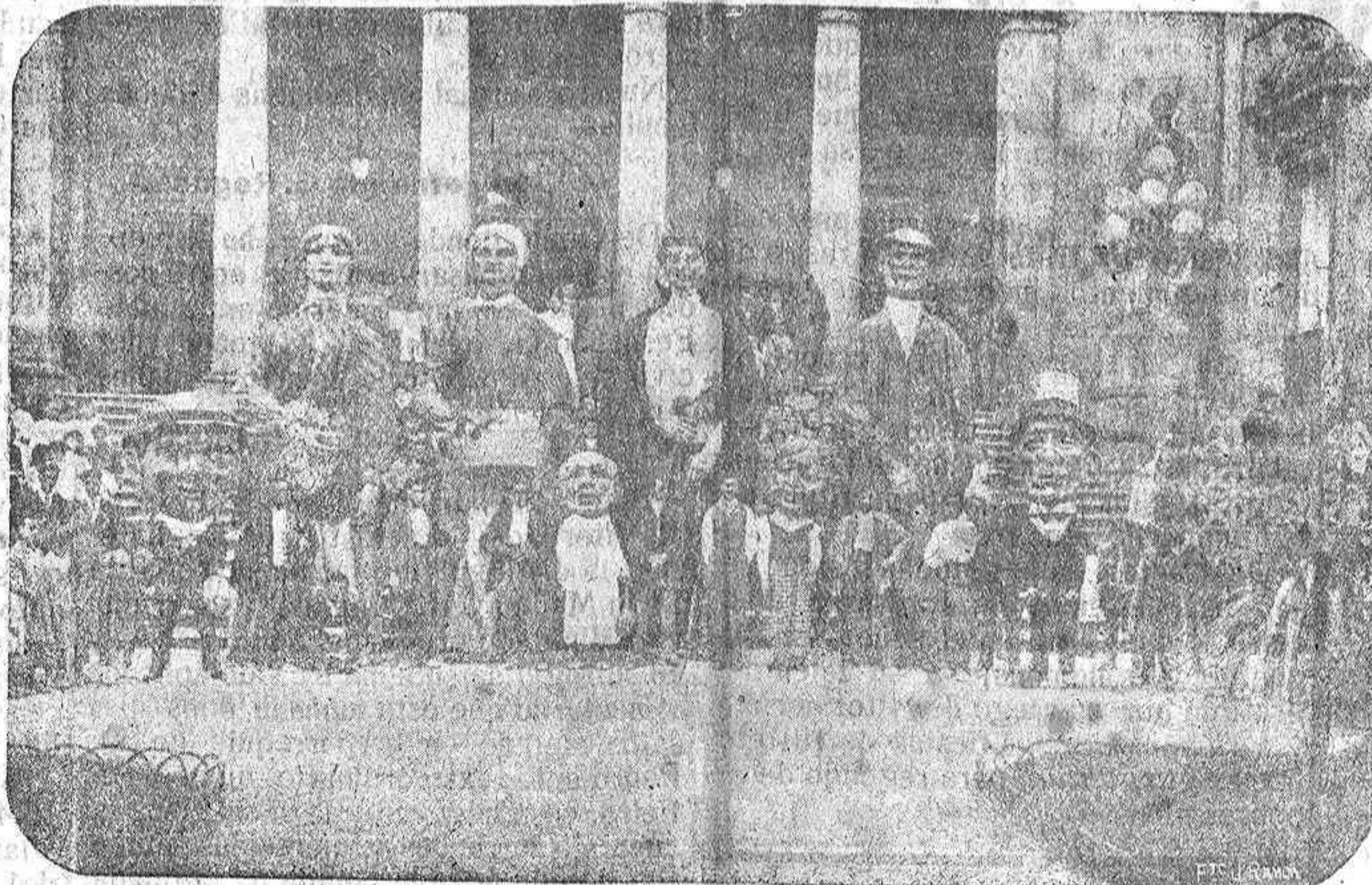
Comparsa de gigantes y nanetes regalada por suscripción popular al Excelentísimo Ayuntamiento y que anoche fué sacada por vez primera en las actuales fiestas