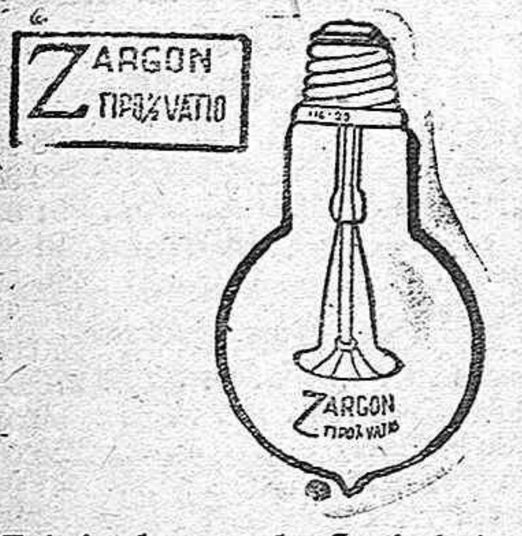
Fabricada por la Sociedad de LAMPARAS Z Cortes, 397, BARCELONA