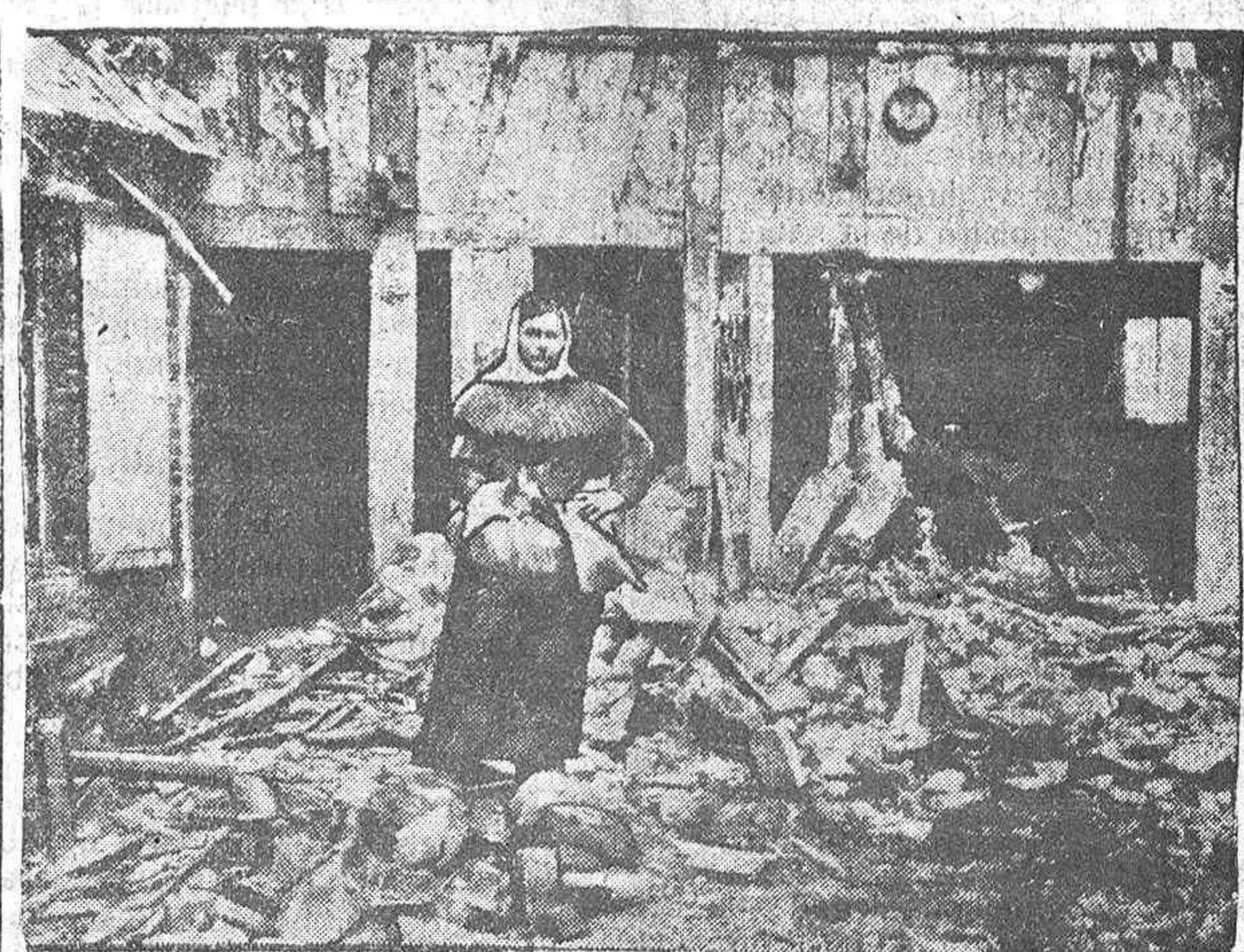
ESTRAGOS DE LA RETIRADA ALEMANA