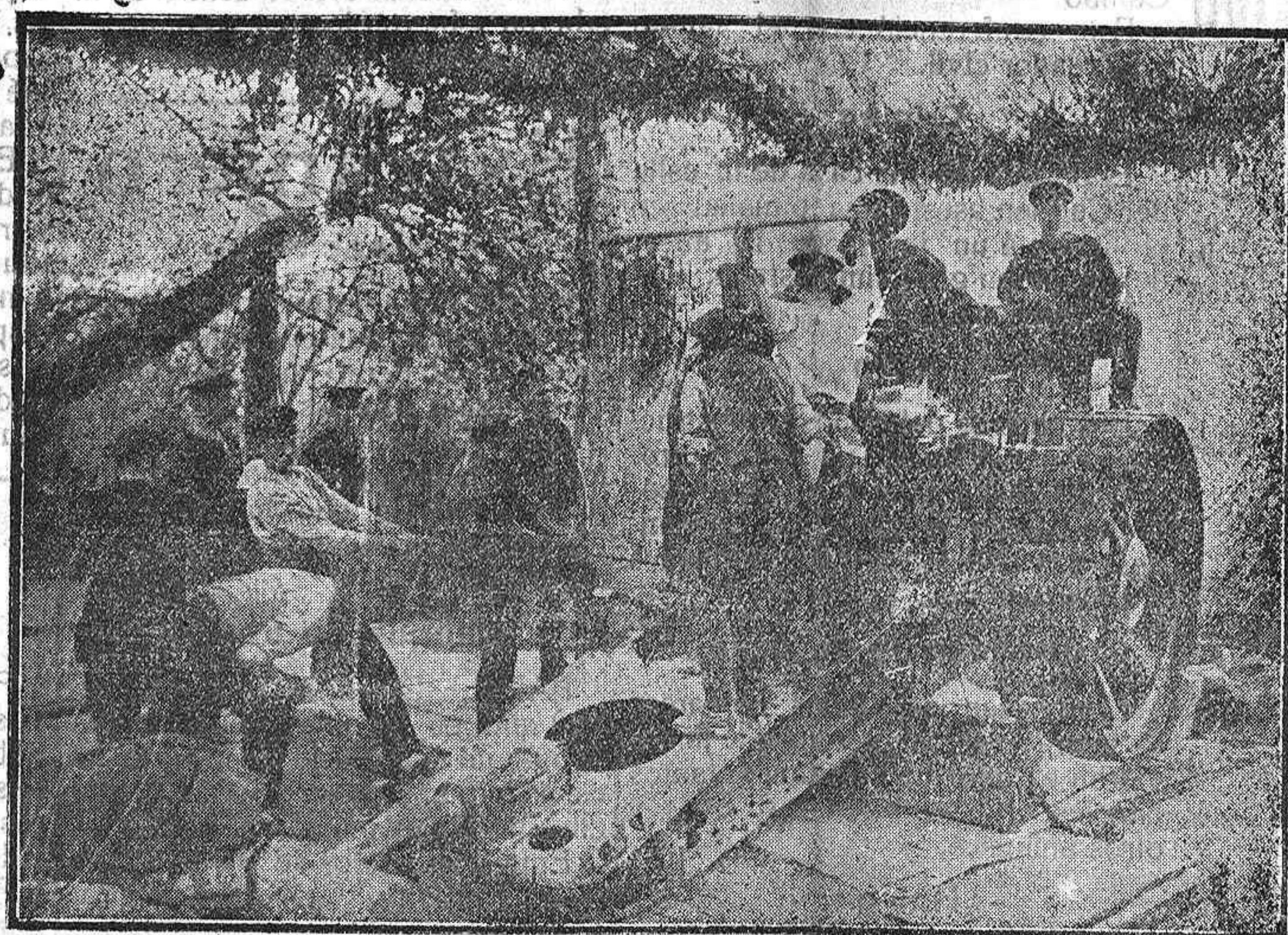
Diseño de cañón inglés de gran calibre.