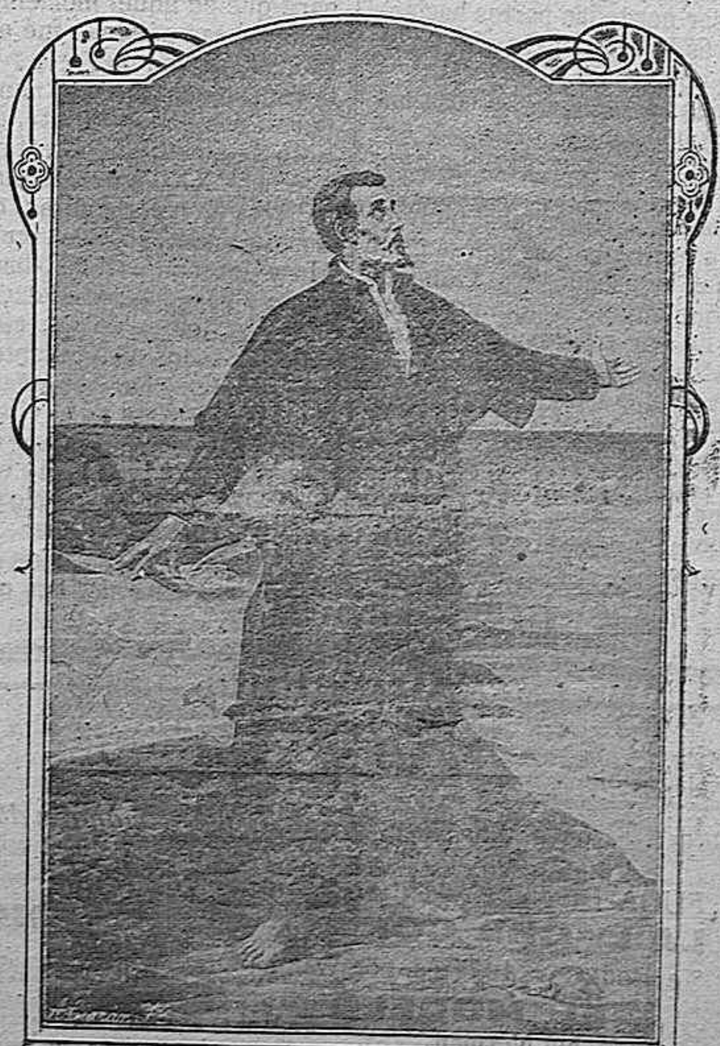
San Francisco Javier

La combinación de luces que con tal destreza sabe disponer el perso-