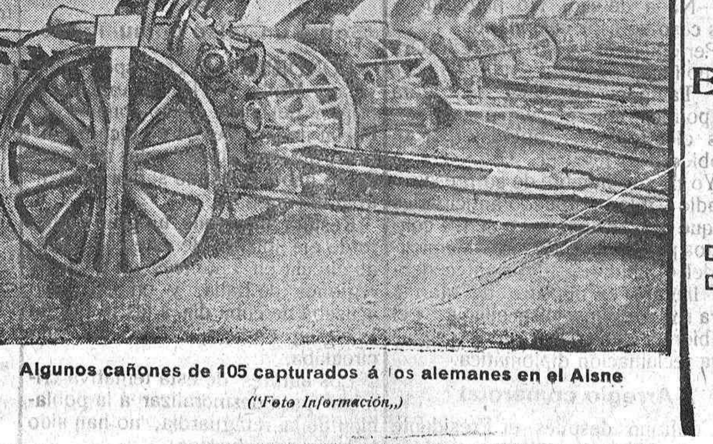
Algunos cañones de 105 capturados a los alemanes en el Alsace