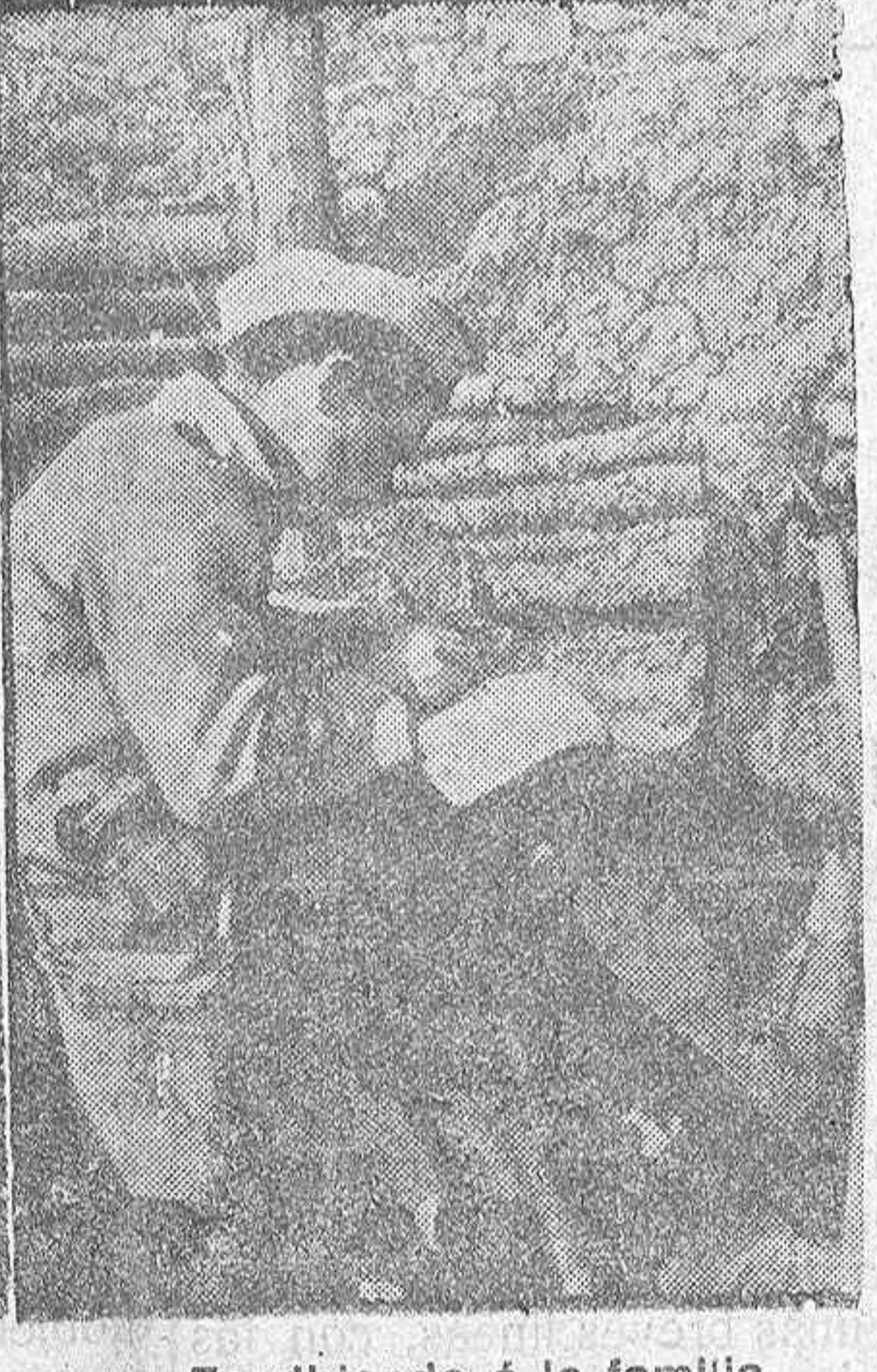
Escribiendo á la familia