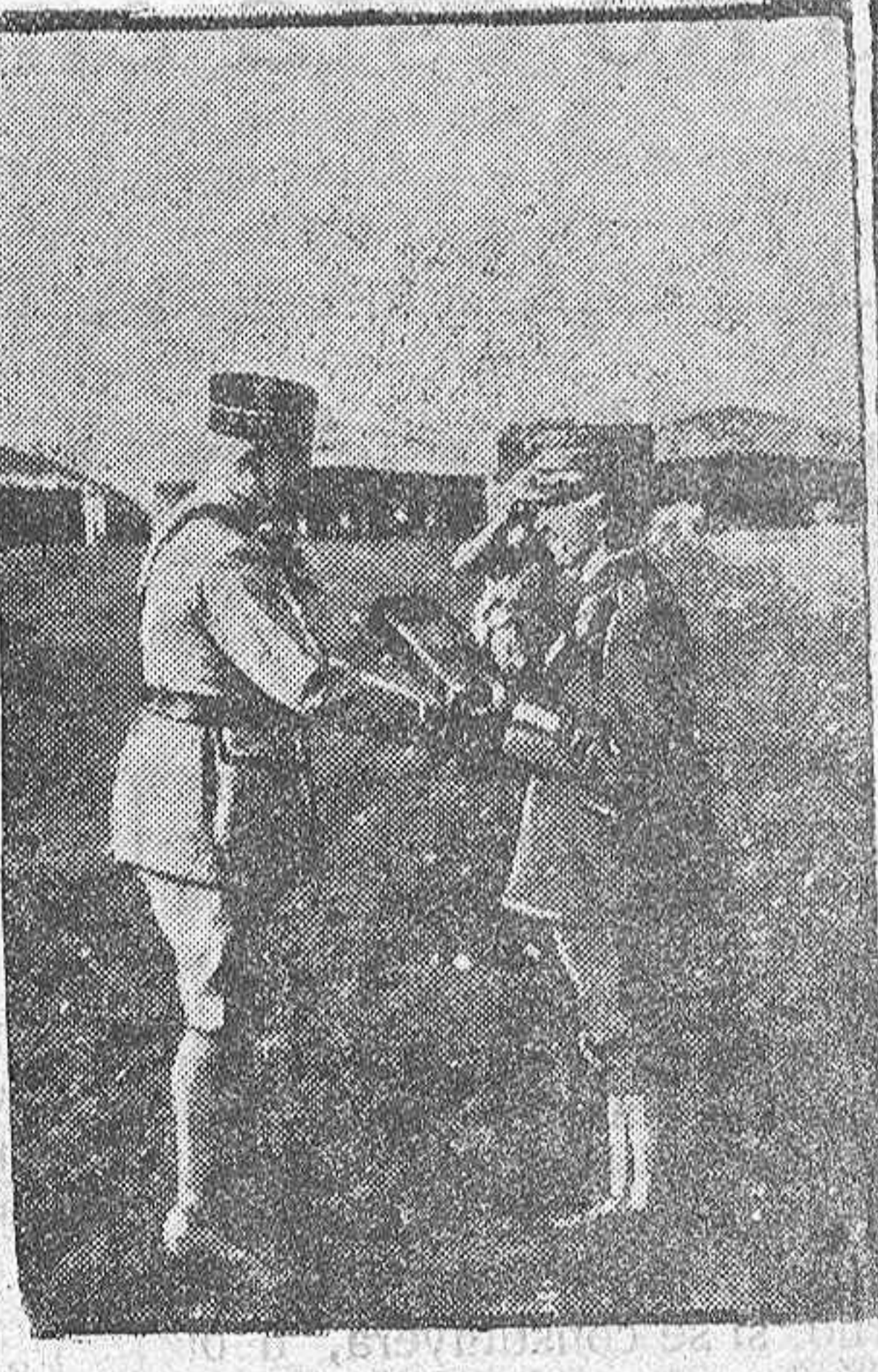
El Rey de Italia condecorando al general Petain