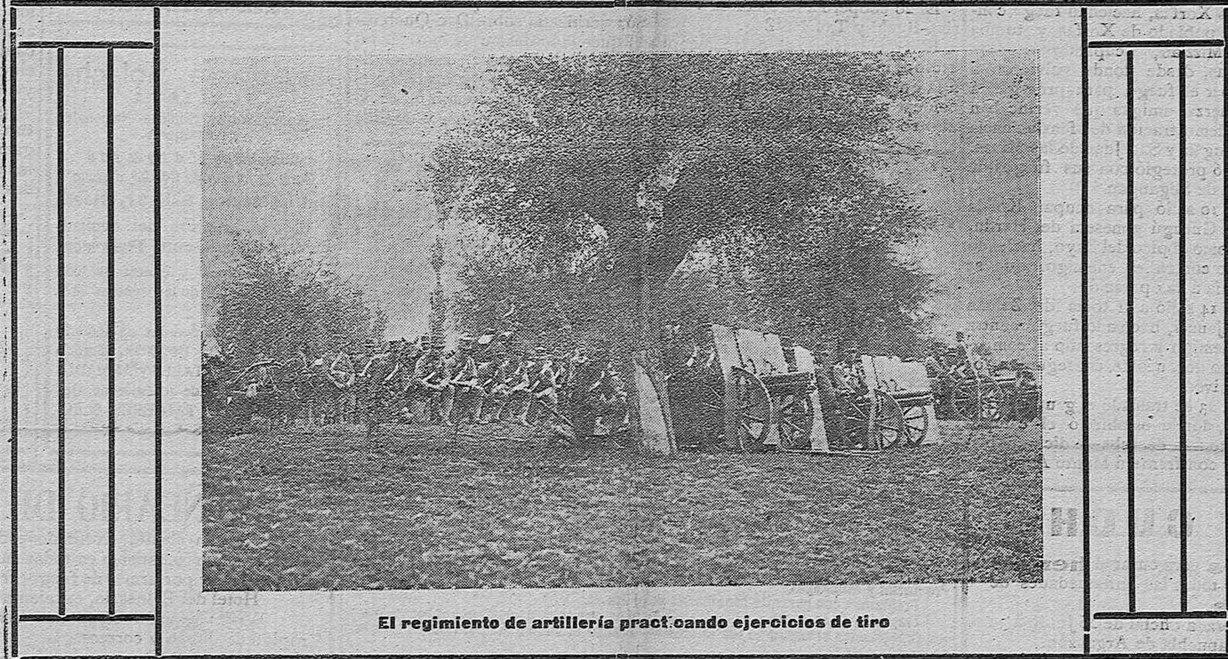
El regimiento de artillería practicando ejercicios de tiro

El 4 salió con la columna a las órdenes del Excmo. señor general don José Sanjurjo a conducir un convoy a Sidi-Amaran, Taguil-Ma-