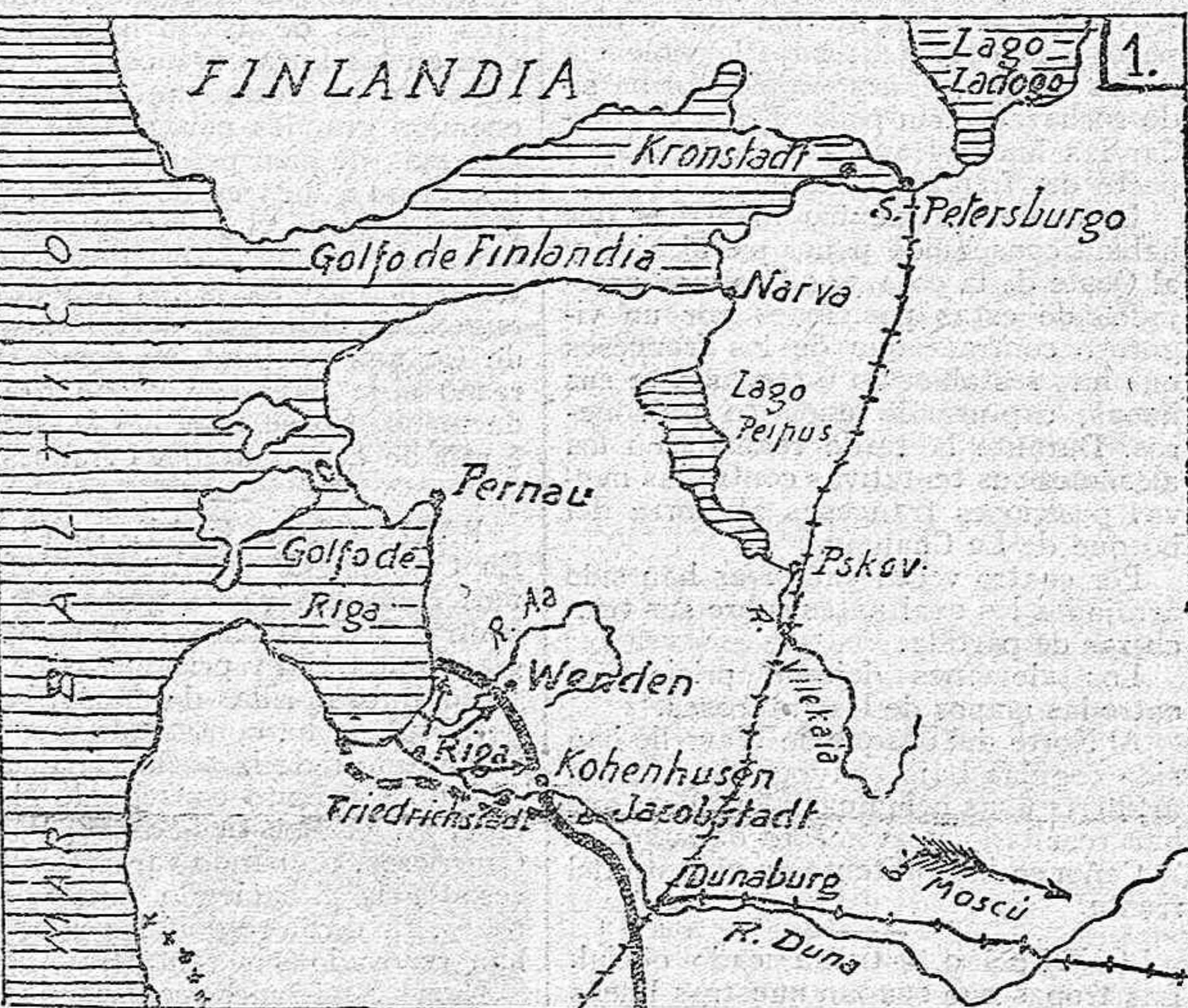
Escala 0. 50. 100. 150. 200. Posicion que ocupaban los alemanes. Posicion aproximada actual.

se vende en el kiosco de la calle de Alcalá.