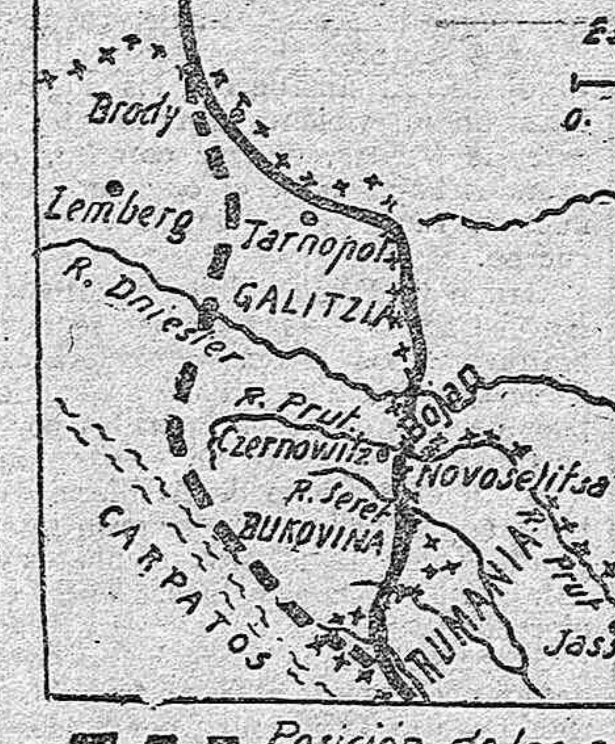
Posicion de los austro-alemanes el 19 de Julio.

Los austroalemanes se han apoderado de la aldea de Bojan (croquis 1 y 2),