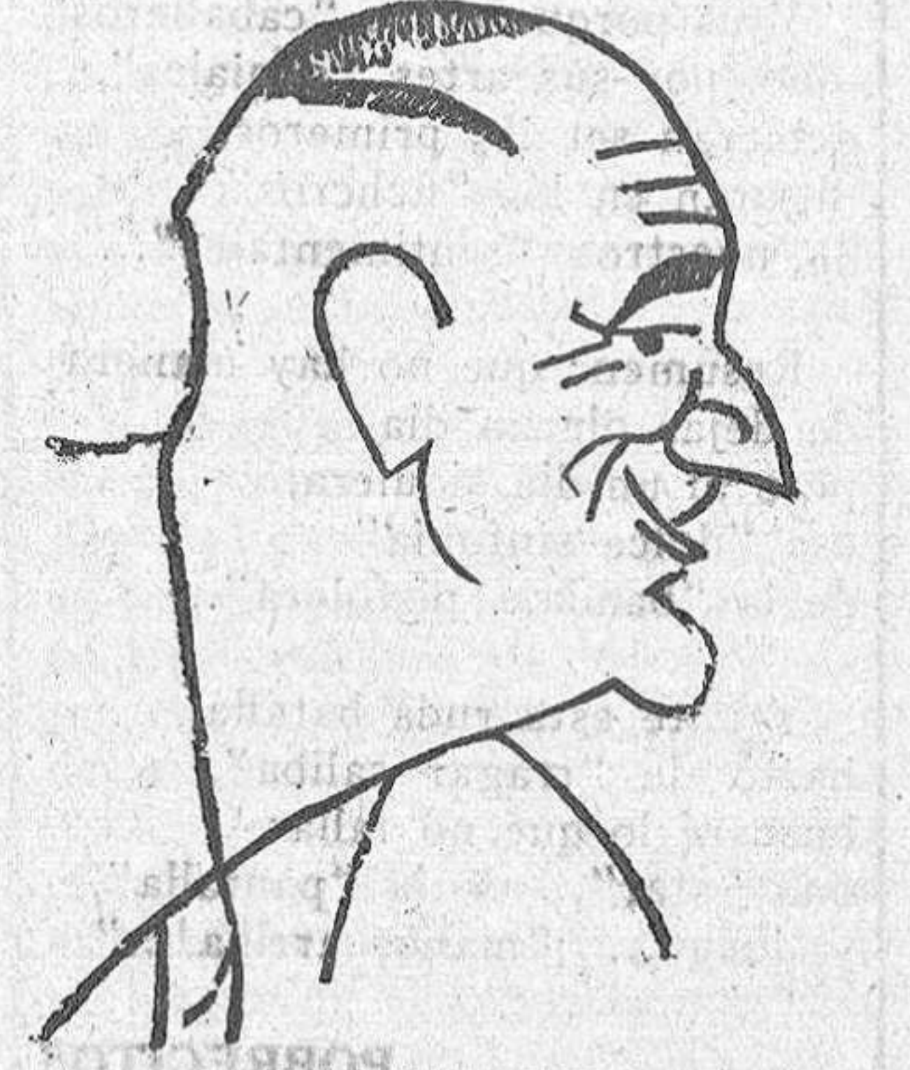
ROOSEVELT candidato demócrata que ha triunfado en las recientes elecciones presidenciales de los Estados Unidos

mas posiciones políticas, están en verdadera armonía con la realidad del país y con las aspiraciones de superación ciudadana y de progreso colectivo de sus habitantes.