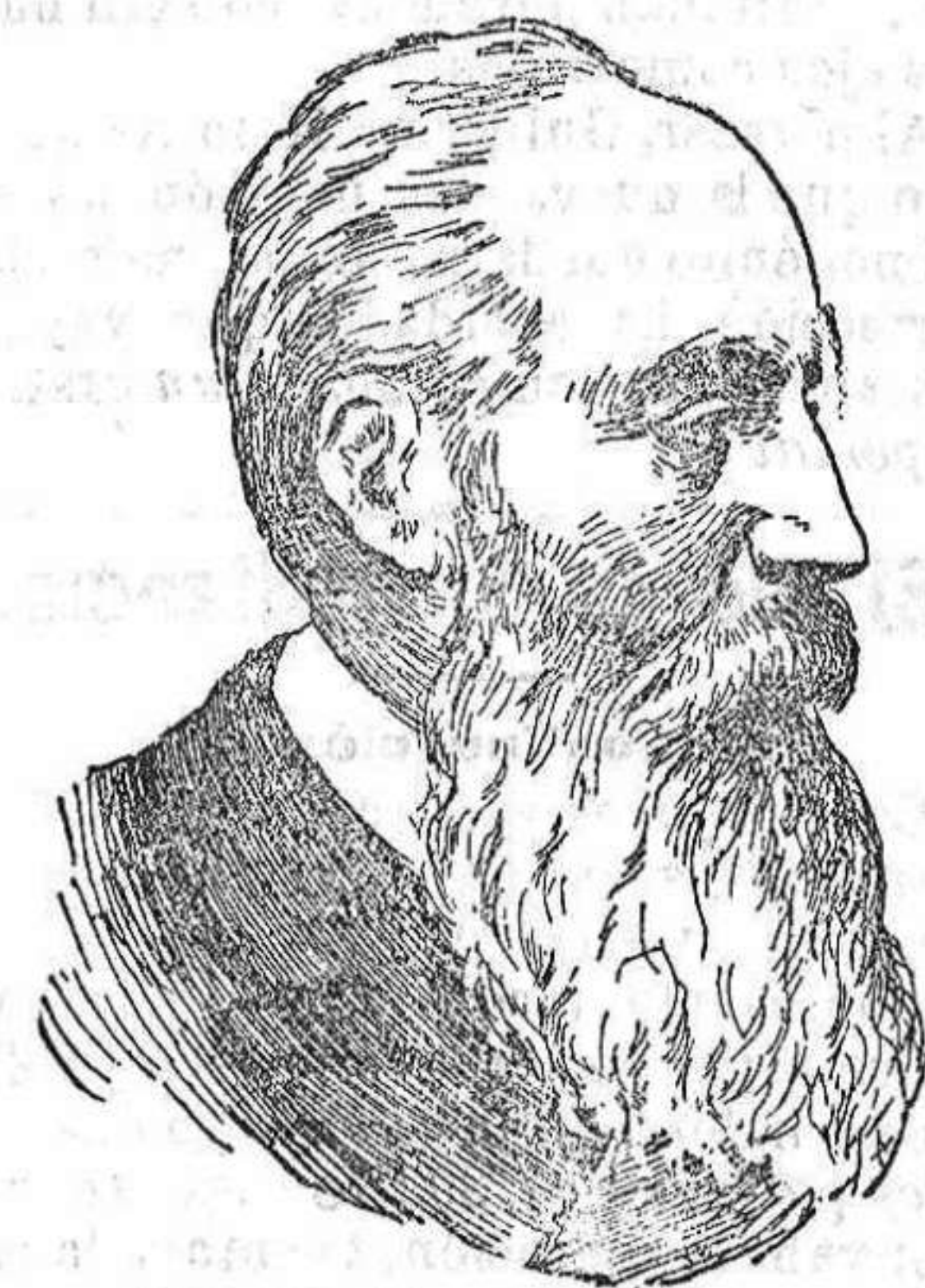
DON ALEJANDRO PIDAL Presidente de la Real Academia Española.