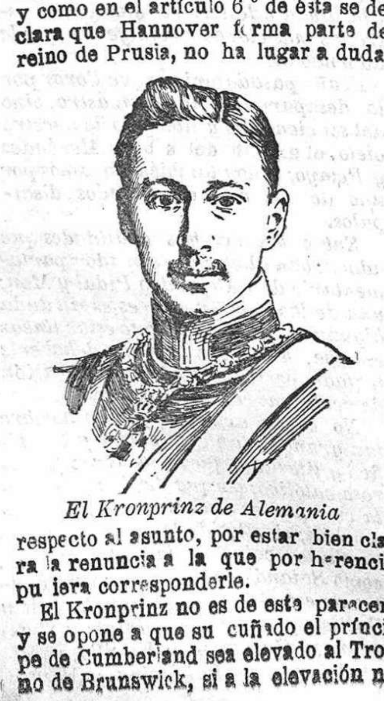
El Kronprinz de Alemania respecto al asunto, por estar bien clara la renuncia a la que por herencia pu lera corresponderle.

Contiene, entre otras notas de actualidad, las siguientes informaciones: La catástrofe del Volturno: incendio a bordo.—El monumento a Romanones en Gualadajara.—La bandera del acorazado España.—La retirada de Bombita y la alternativa de Bismonte.—Los delegados franceses en Andalucía.—Les maniobras militares en Inglaterra.—Concurso de aviación en Berlín.—Monumento a Verdi en Milán.—Los últimos combates de Marruecos.—El Congreso de Hidrología en Madrid.—Blanes pintoresco, etc., etc.