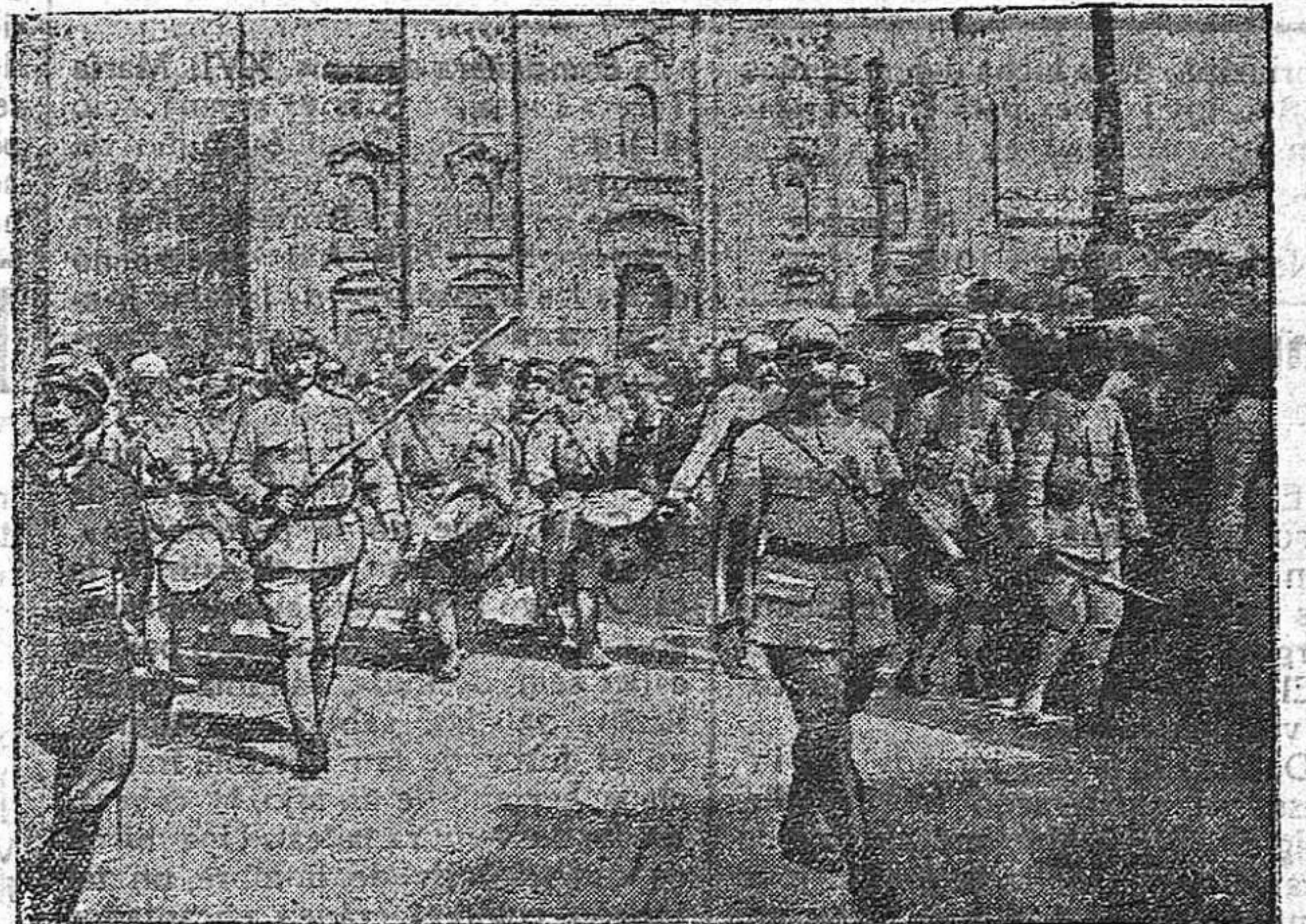
DE LA GUERRA.—Aniversario de la entrada de Italia en la guerra.—Desfile de tropas francesas en la plaza de Dome.

Ayer vió la luz pública el periódico de feria Guasa Viva que por su