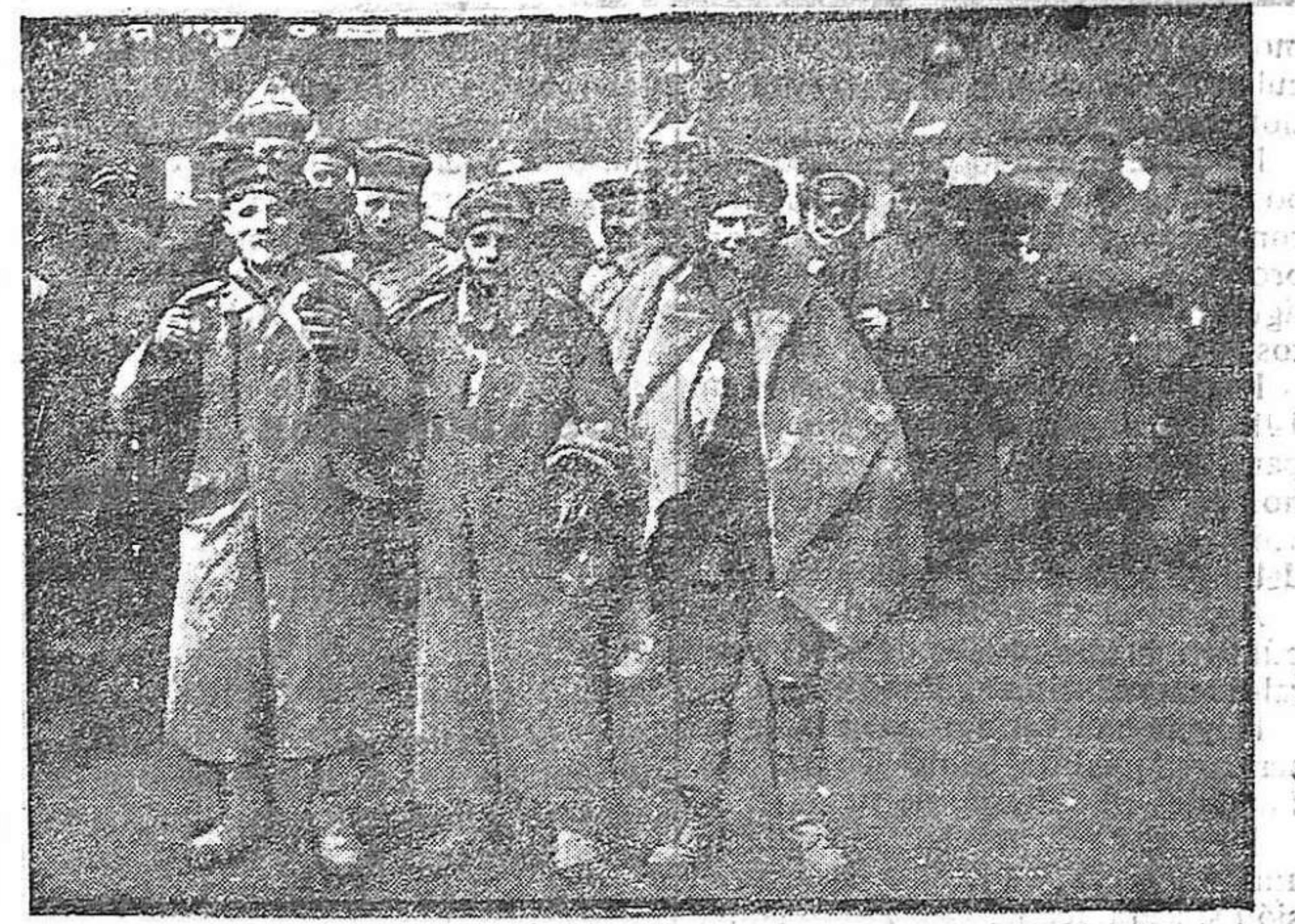
DE LA GUERRA.—Jóvenes prisioneros alemanes capturados por los franceses.

posiciones de vanguardia y solo reacciona con violentos contraataques típicos.