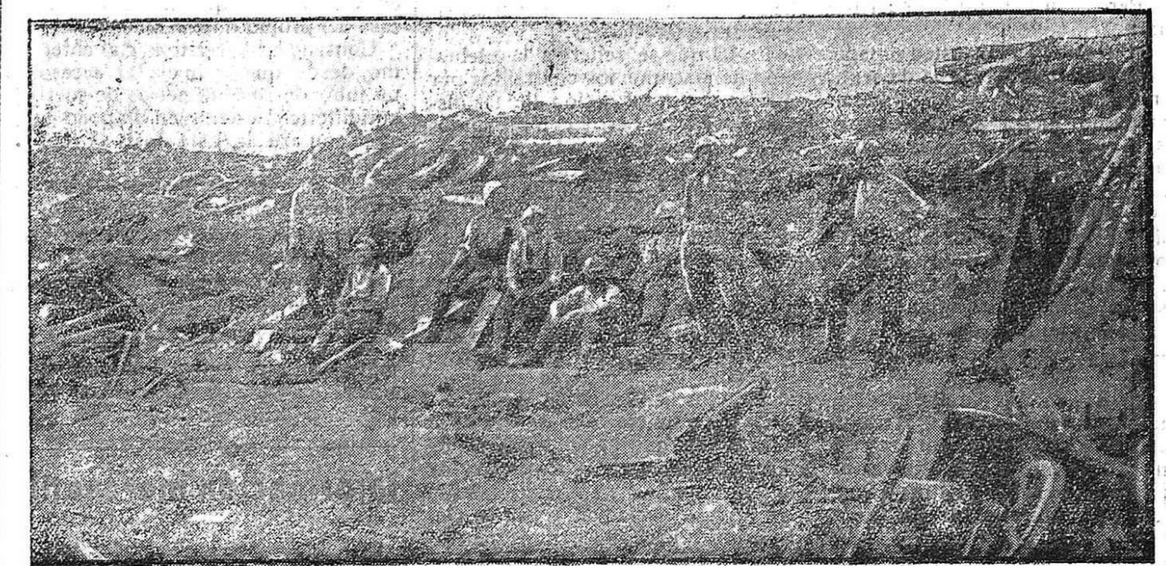
DE LA GUERRA.—Cañón francés de trincheira y sus servidores.

Probablemente no ha habido otro hombre más fantástico, más pintoresco en sus operaciones matemáticas, en sus cálculos. Quiso ser impresor y editor —para lo cual constituyó una sociedad, comprometiéndose en un negocio de varios miles de