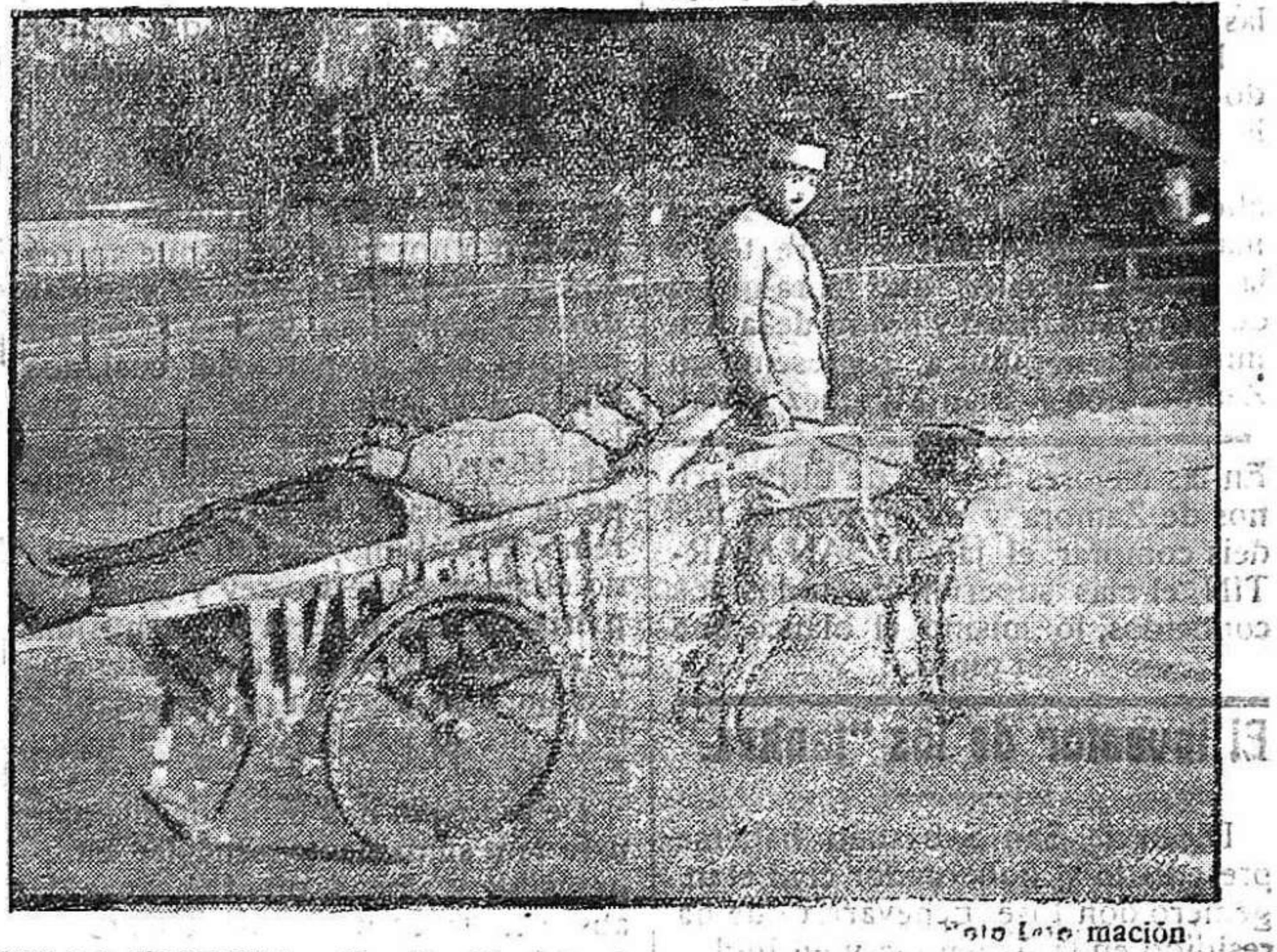
DE LA GUERRA.—Carrito tirado por perros para el transporte de heridos

Es curioso observar la impresión de aislamiento, de una especie de soledad espiritual que se produce en las multitudes cuando una huelga ferroviaria, como en el verano último, o una interrupción de los servicios postales o telegráficos como acaba de acontecer en los días anteriores, rompe nuestras comunicaciones ordinarias y hasta parece que corta nuestras relaciones espirituales. Es algo como si en torno nuestro hiciera de pronto el vacío o como si por un fenómeno extraño nos sintiéramos solos, como Robinson en su isla, en medio de las mismas grandes multitudes con las cuales diariamente convivimos. Lástima es que un Maeterlinck no haya estudiado esa sensación colectiva de inquietud, con aquella misma perspicacia con que estudiara la sensación vaga presintiendo la proximidad de la muerte como en La Invasión o el dolor de la trágica soledad y del irremediable abandono como en Los ciegos . Esta solución de continuidad en nuestras comunicaciones, surgida repentinamente, aun para aquellos que raramente se comunican con nadie, nos hace sentir de pronto lo que es la ausencia y comprender muy al vivo lo que es la ausencia. Con el telégrafo estamos al habla constantemente, hasta con los países más remotos, como si en el mundo no existieran distancias materialmente irreductibles; con las rápidas comunicaciones postales nos hacemos la ilusión de que no hay ausencias reales y convivimos con los seres más distantes por medio de las cartas, que van y vienen, como si ellas