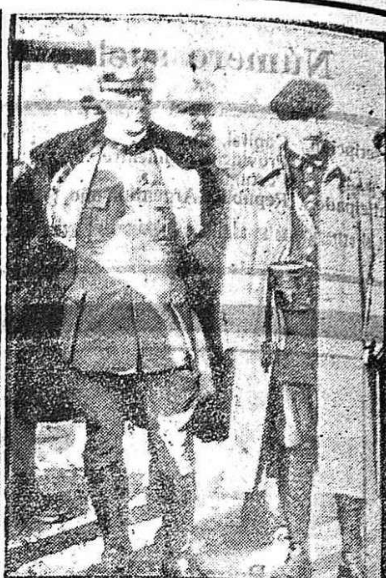
El general PEPPINO GARIBALDI

El centeno se cotizó a 60 reales fanega, cebada a 54, algarrobas y yeros a 60.