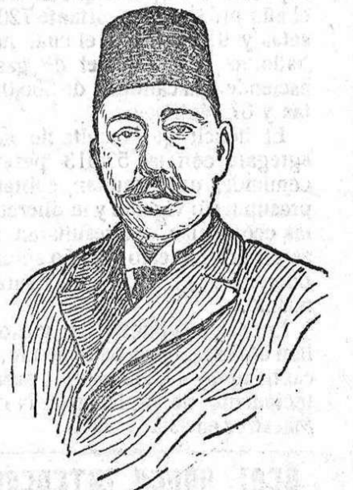
Mahonict V sultán de Turquía.

cifras anteriores no van incluidos los prisioneros de Amberes. Ignoramos si los 12.000 prisioneros alemanes que hay en Francia lo han sido todos en el campo de batalla o en ellos van incluidos los alemanes apresados en el mar cuando marchaban a incorporarse a filas. Según los anteriores datos, la proporción es un prisionero alemán por 30 de los aliados.