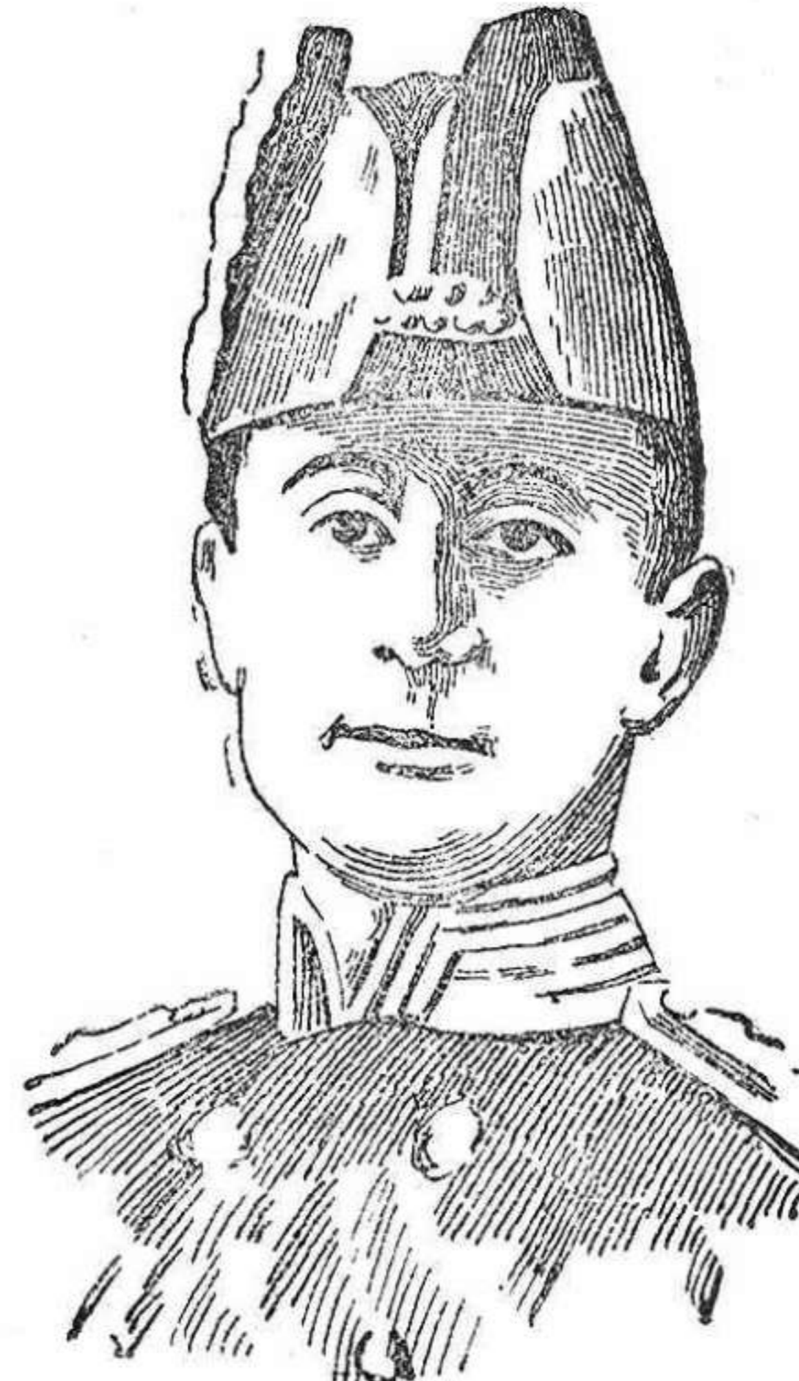
Almirante inglés Sir John Jellicoe, que manda la escuadra inglesa que lucha contra Alemania y Austria.