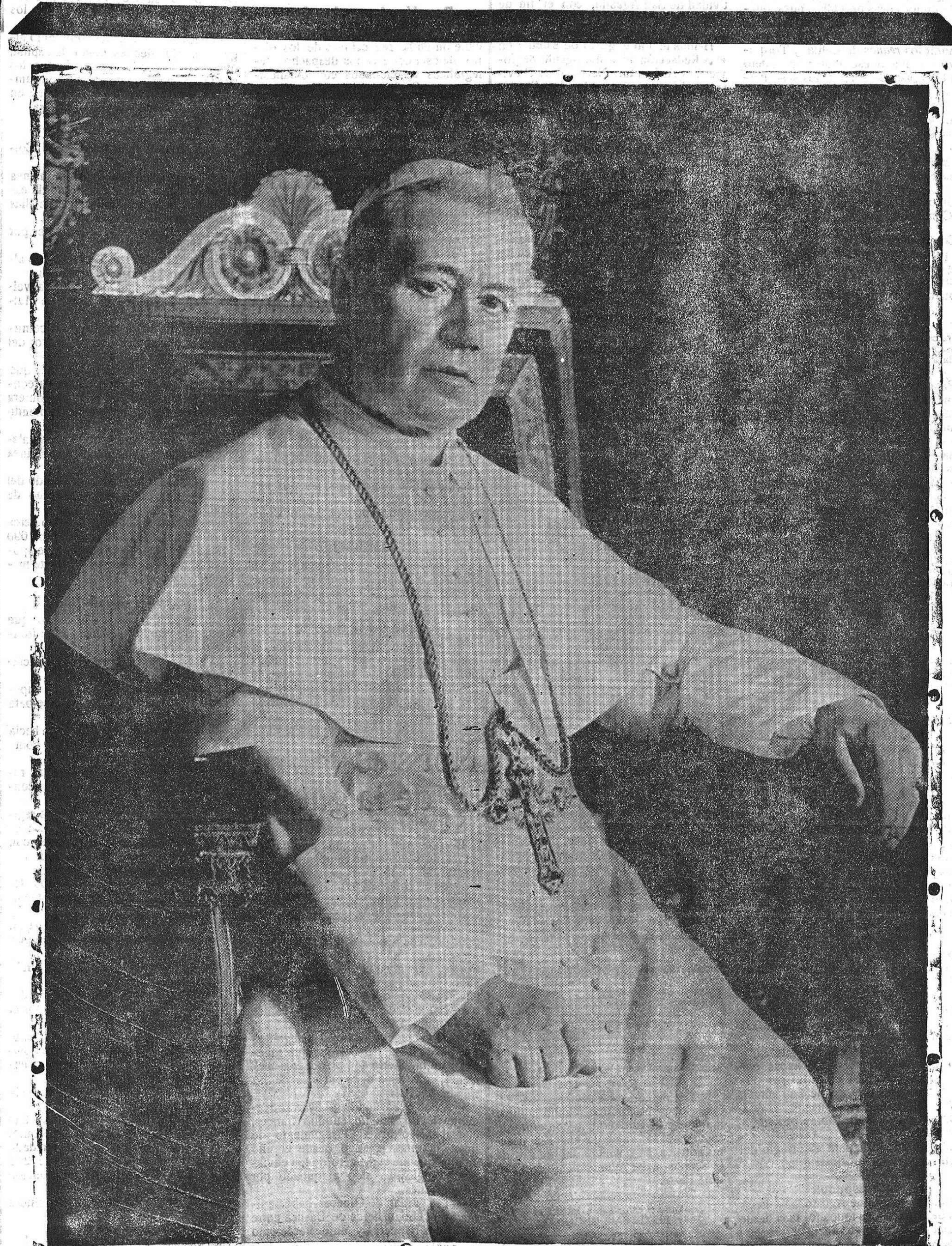
S. S. el Papa Pío X† en la madrugada del 20 del actual.

Las solicitudes para prueba de aptitud en el Cuerpo de camineros han de presentarse en las Jefaturas de Obras Públicas, desde el 1.º al 15 de Septiembre próximo, acompañadas de los documentos que determinan las convocatorias de 15 de Julio, publicadas en los Boletines Oficiales de las provincias, es cogiéndose, para formar la relación de aspirantes en cada Jefatura, los cincuenta mejores.