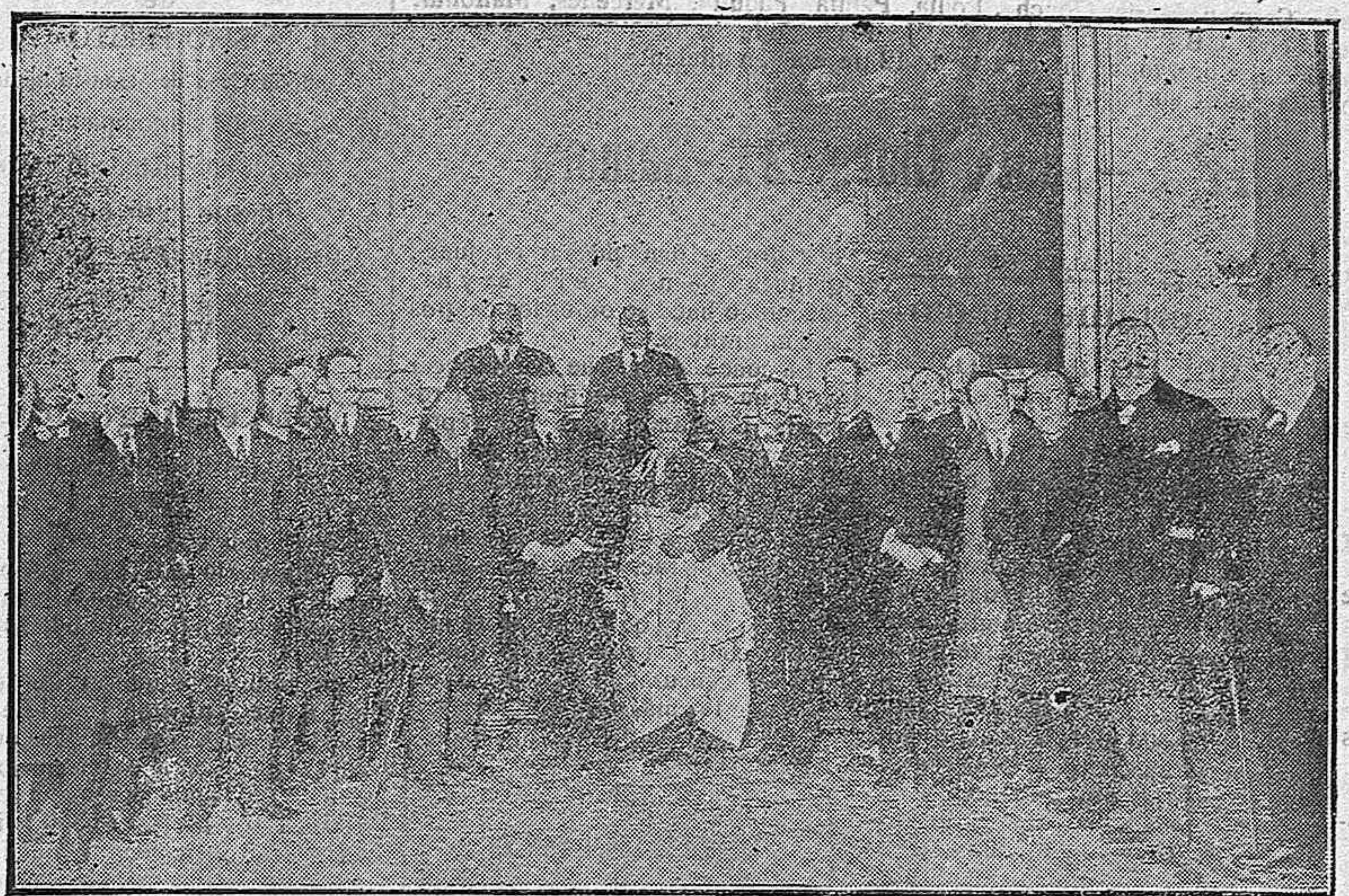
Las Comisiones de Salamanca y Zamora, reunidas en la sección tercera del Congreso para cambiar impresiones.