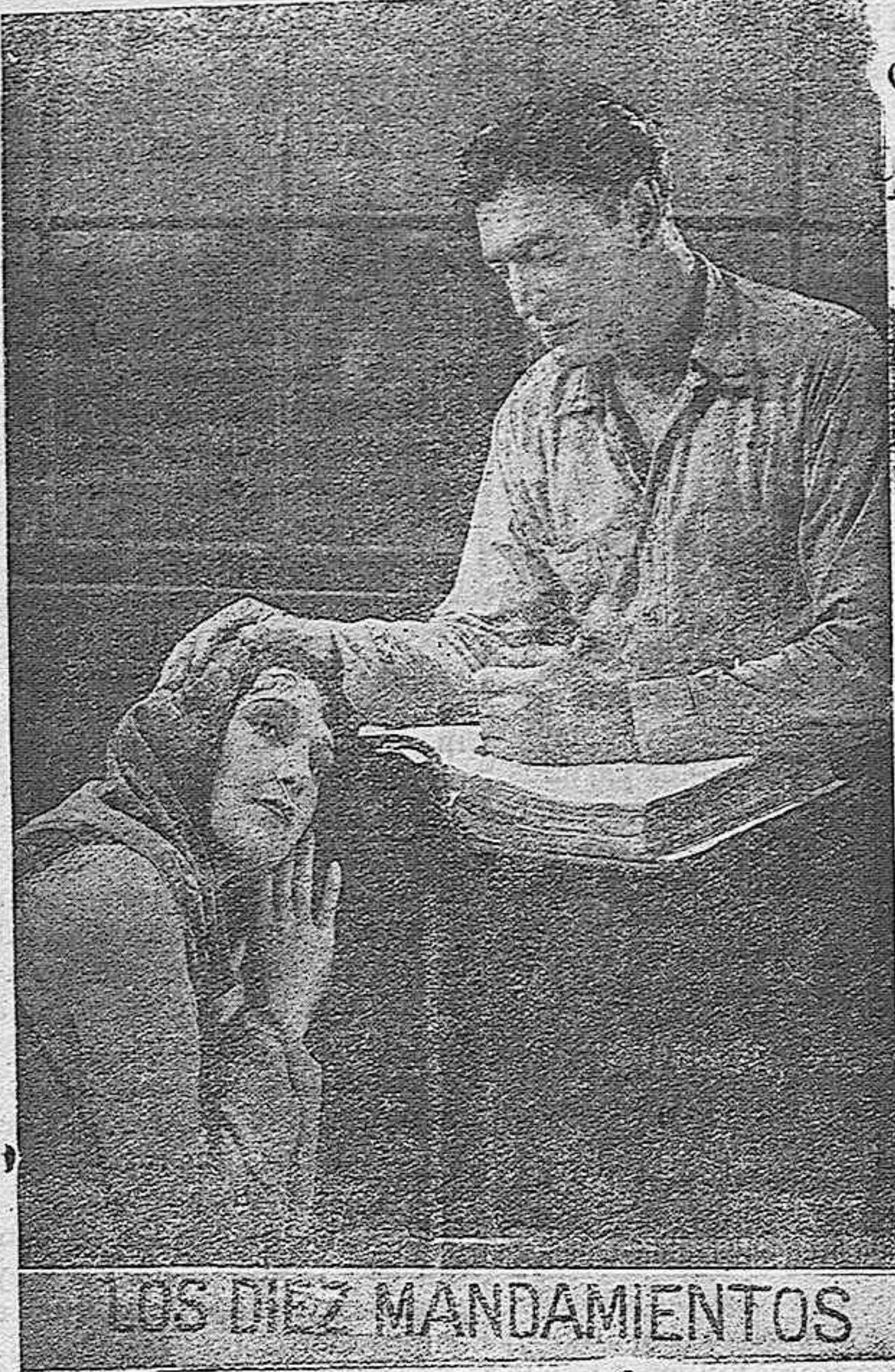
Una escena del drama de la grandiosa película "Los Diez Mandamientos" que se estrenará el Domingo, 15, en el Teatro Principal.

Estado, 100 bomberos y 250 soldados. Se tuvieron que fabricar más de 3.000 vestidos, para los cuales se emplearon 10 kilómetros de tela. Para los arneses de los 250 caballos de Faraón, se emplearon tres toneladas de cuero. Tomaron parte en esta película 900 caballos, 50 camellos, 1.500 corderos y cabras, 300 aves, 50 pe-