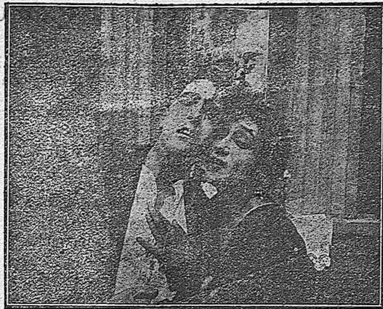
Una de las más bellas escenas de la preciosa película «La Dolores», que se estrenará mañana jueves en el Teatro Principal.

El éxito del maestro Bretón fué personalísimo, rotundo y duradero. Consegro para siempre su eminencia en el arte musical.