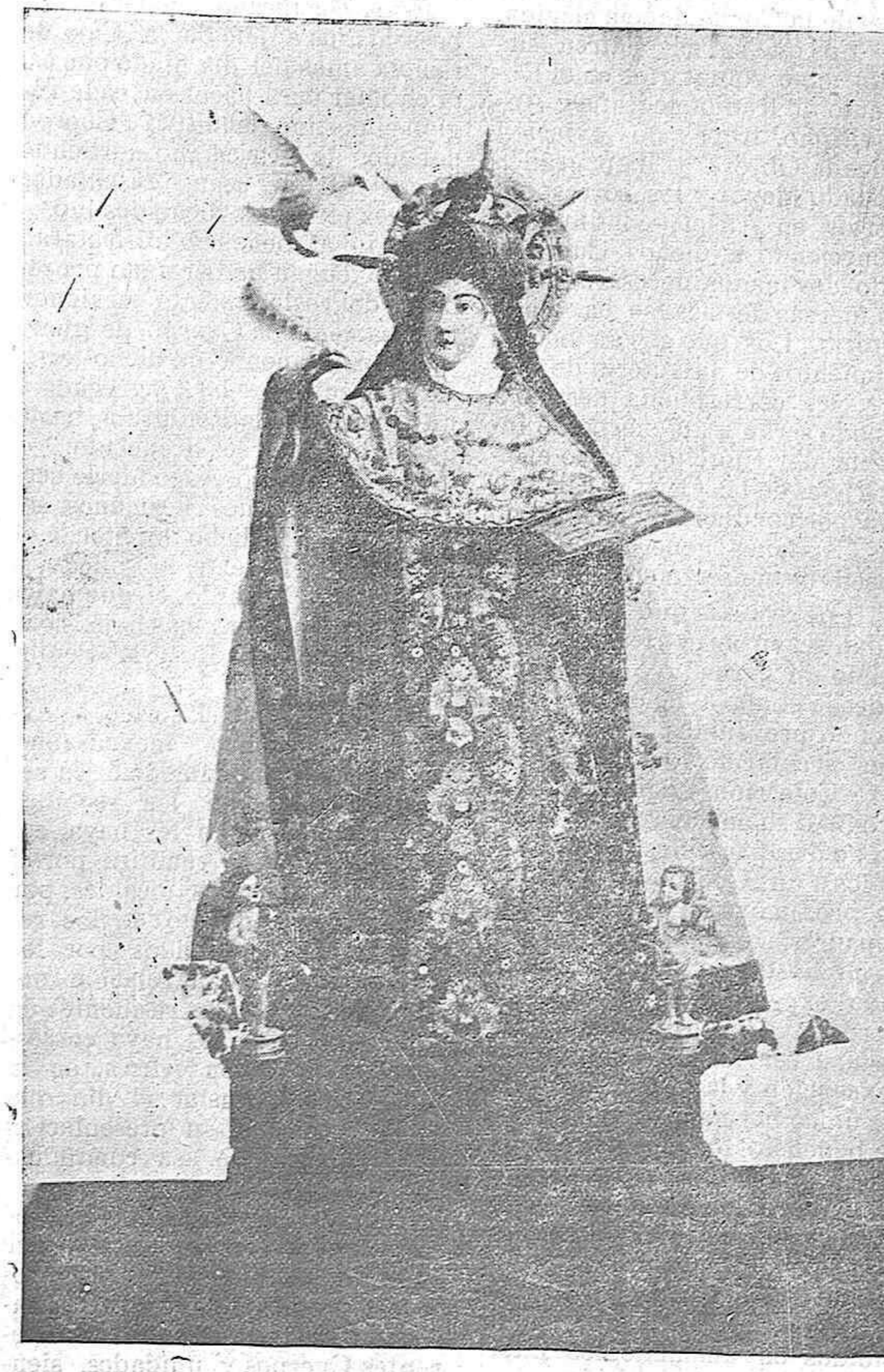
La seráfica y mística doctora Santa Teresa de Jesús, preciosísima imagen que se venera en la Basílica de Alba de Tormes.