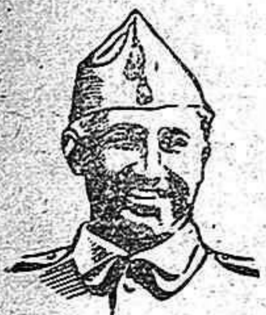
Francisco, Franco, Franco ¡Arriba España!

...Y después de una lucha de ocho siglos, el alma hispánica que logró su unidad nacional—territorial y católica—al conquistar el reino de Granada, descubrió su providencial destino de universalidad, de imperio.