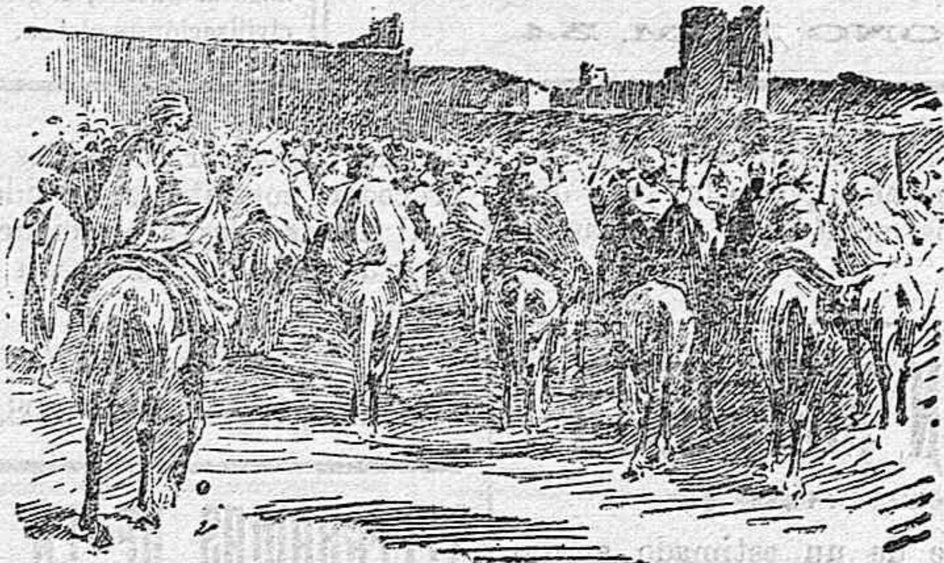
MULEY HAFID EN FEZ.—Mehalla afidista ante la muralla y torre de la puerta de Bab-el-Segma.