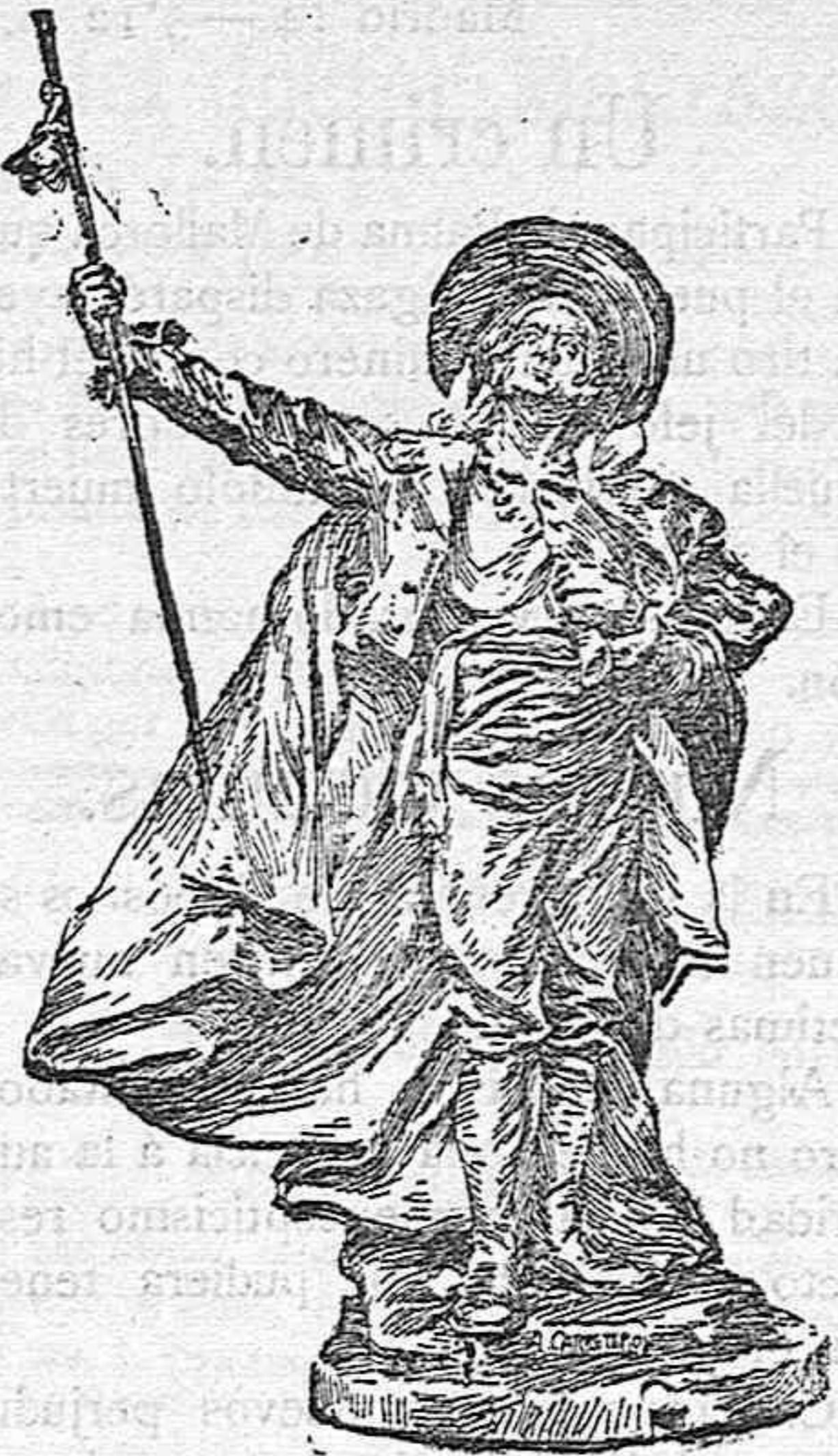
Estátua de don Andrés Torrejón.

Entre los múltiples festejos que han de celebrarse con motivo del primer centenario del 2 de Mayo de 1808, figura como uno de los más salientes, la inauguración del monumento erigido en la plaza de Mostoles á su célebre alcalde don Andrés Torrejón.