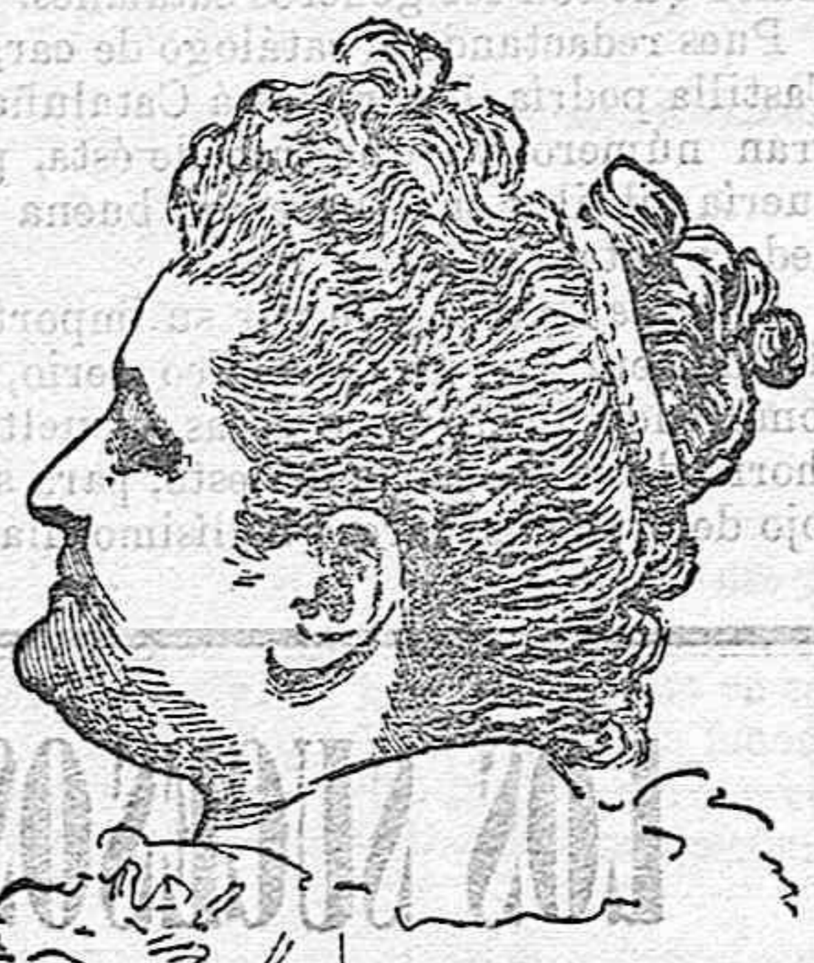
Doña Emilia Pardo Bazán. SU NUEVA OBRA

La eximia escritora doña Emilia Pardo Bazán, acaba de enriquecer la larga serie de sus obras, labor literaria no por lo numerosa menos notable, con un nuevo libro.